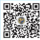
“珠海平安指数”官方微信公众账号

2019年11月,在平安指数发布五周年之际,珠海市以中央政法委提出的“市域社会治理现代化”重要理念为切入点,以市域层面各类安全“大数据”为支撑,将平安指数优化升级为涵盖14项分类指数的珠海“平安+”市域社会治理指数。新版指数分为日度指数和月度指数,日度指数由7项分类指数构成,每日发布;月度指数由14项分类指数构成,每月15日发布。想了解更多更具体的平安信息,请关注“珠海平安指数”官方微信公众了解和参与平安珠海建设。