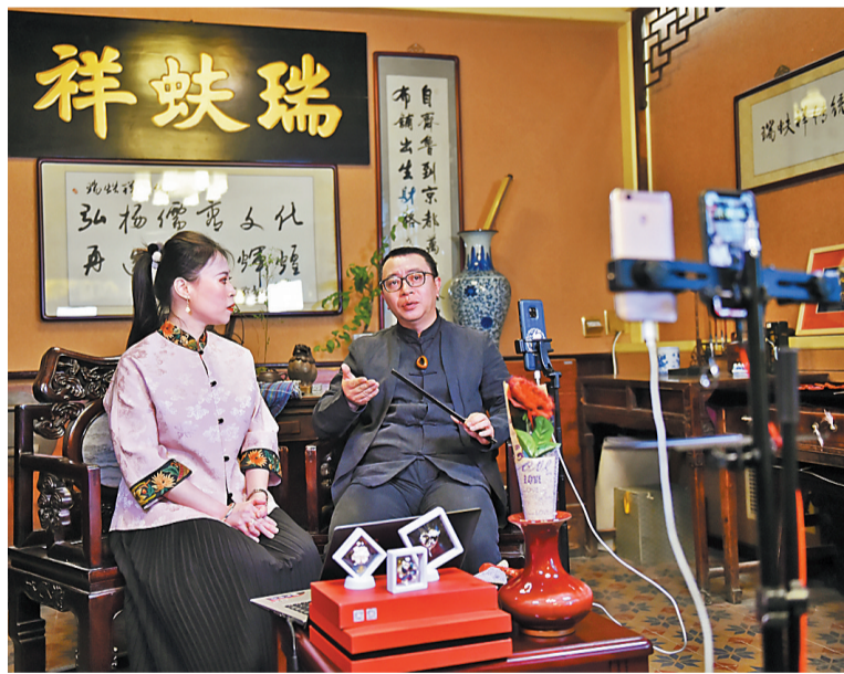
4月6日,瑞蚨祥工作人员在进行网络直播。

据了解,接下来将有更多京城老字号参与网络直播活动,以“有年头的品牌,有温度的手艺,有故事的产品”吸引更多年轻人走近老字号,了解其历史源流、技法绝活。