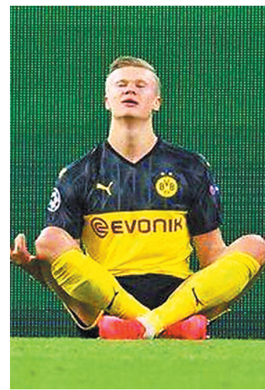
“新银河战舰”“一快一高”锋线组合将令任何对手胆寒。

本报讯 据西班牙媒体《马卡报》的消息,皇马主席弗洛伦蒂诺对皇马的2022年有着超级计划。