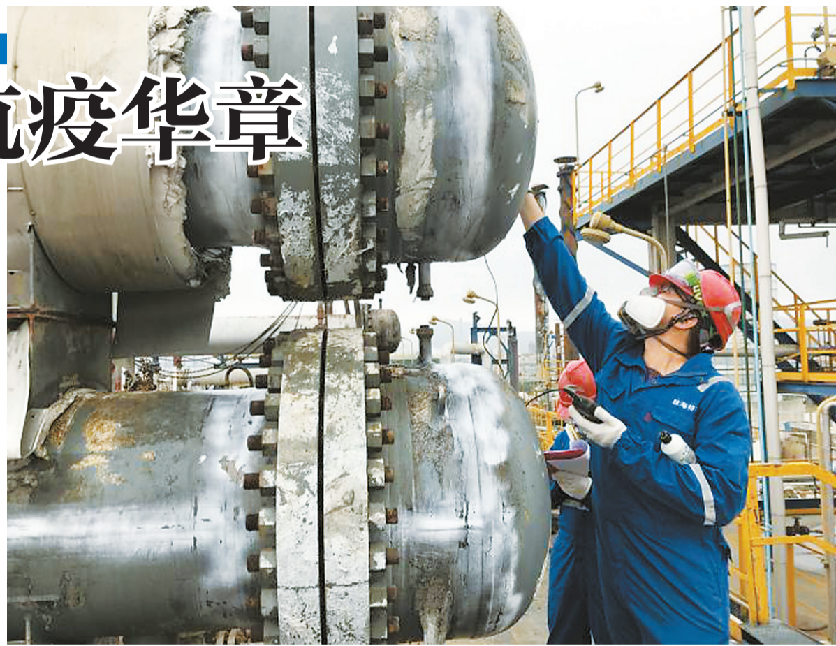
珠海检测院技术人员深入企业开展特种设备检验工作。

疫情期间,珠海检测院确保窗口服务不打烊、不断档、不降质,让办事群众感受到别样的温暖。