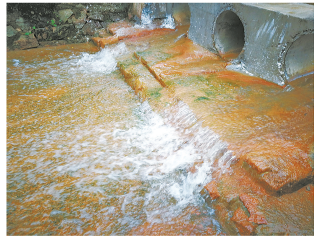
斗门镇大濠冲村大庙坑排洪渠黑臭水体变得清澈干净。

本报讯 记者张帆报道:清掉1米深的淤泥,放置大石块、铺上小沙石……经过3个日夜的加班施工,斗门镇大濠冲村的大庙坑排洪渠变得清澈见底,往日被村民避而远之的黑臭水体荡然无存。连绵青山、1.5公里长的悠悠渠水、绿油油的稻田、洁净的村巷,组成了一幅生态宜居、美丽乡村画卷。