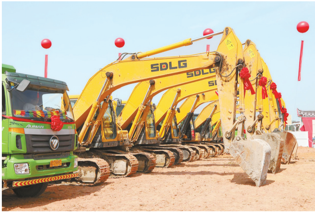
珠海·宋城演艺度假区项目开工仪式现场。