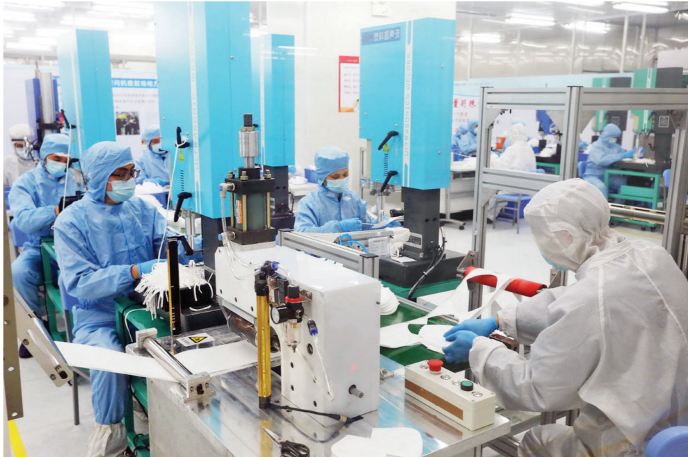
珠海健格医疗科技口罩生产线。