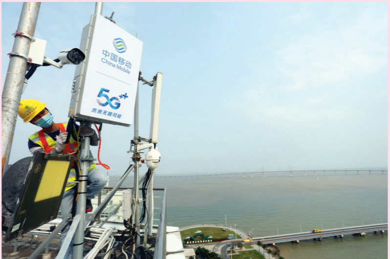
珠海5G基站建设加快推进。