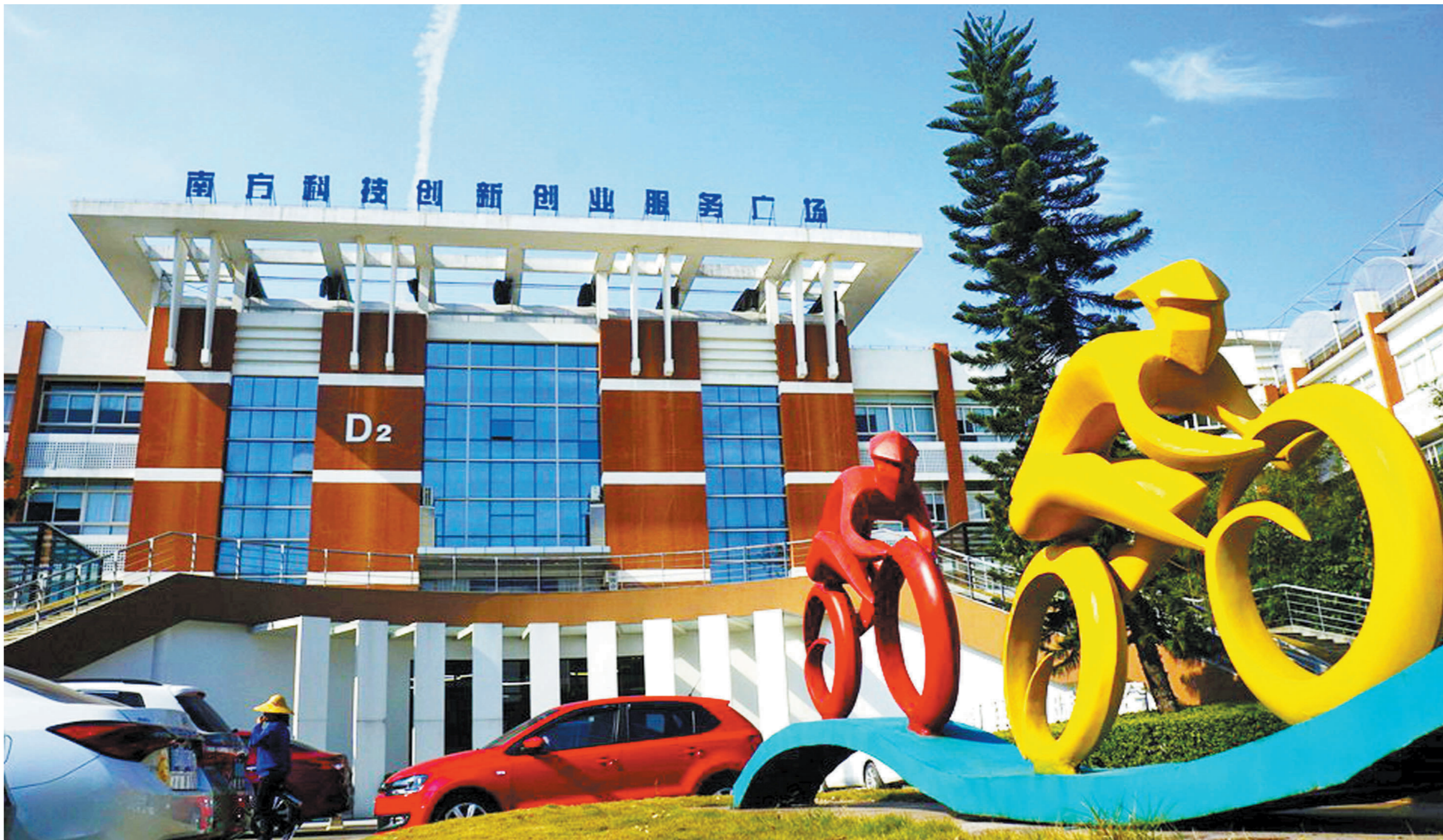
珠海高新区南方科技创新创业服务广场。