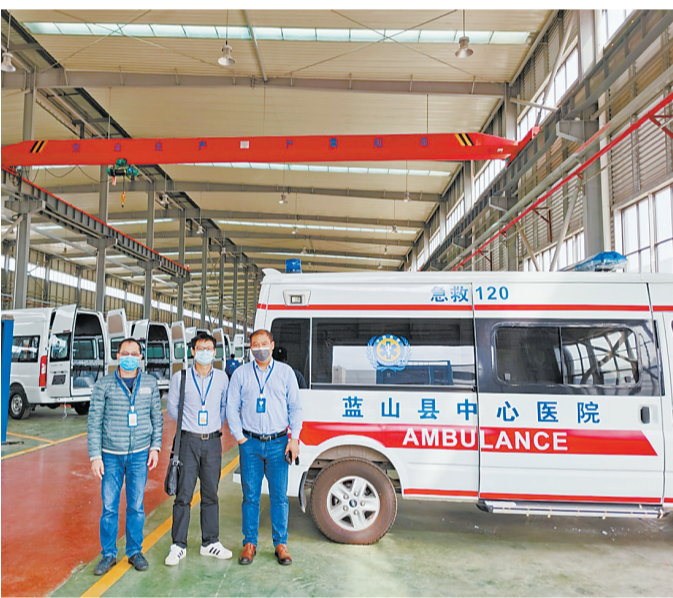
工商银行珠海分行实地走访抗疫物资生产企业,用金融活水解决复工复产难题。

珠海地区经济社会发展目标实现的重点领域、重点产业及重大在建、新建扩建等项目的信贷投放。截至目前,累计为珠海市41个重点项目提供587亿元授信支持,为香海大桥、鹤港高速等重大基建项目发放项目建设资金6.28亿元,为珠海市18个大中型企业和重点项目提供复工复产融资支持11.52亿元。并通过“E抵快贷”“税易通”等产品为290户小微企业提供17.32亿元资金支持,为357名小微企业主提供7.57亿元的信贷支持。对受疫情影响较大、暂时受困的企业,积极通过贷款展期、再融资、结息周期调整等措施帮助企业防止资金链断裂,共受理企业延期付息及调整还款计划68户,涉及金额21.4亿元,用实际行动与受困企业共渡难关,推动企业复工复产进入快车道。