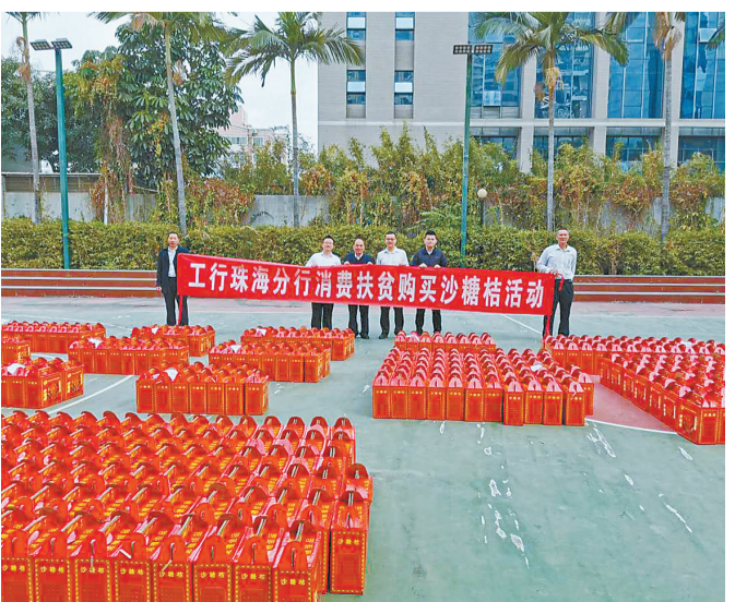
工商银行珠海分行集中采购5000斤沙糖桔帮助桔农解决滞销问题,为决战脱贫攻坚贡献力量。

业扶贫模式,在扶贫地区开展了金阳花、通江土猪、南江黄羊、万源黑鸡等多个种养项目,有效带动了当地贫困户脱贫致富,其中小小的“金阳花”成为脱贫致富的“利器”。与此同时,工商银行珠海分行充分发挥“融e购”线上平台的作用,通过“扶贫专场”“购物节”“企业团购”等专题活动,分批次采购金阳“天地精华”青花椒、白魔芋、“黑珍珠”苦茶、松茸、核桃等扶贫特产,合计购买金额达50多万元,极大解决了受疫情影响较大地区滞销农产品的销售问题,帮助贫困农民缓解燃眉之急。