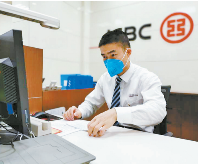
工商银行珠海分行用优质高效的服务为疫情防控和复工复产提供强有力的金融支持。

下一步,工商银行珠海分行将继续围绕外贸外资企业在跨境产业链各个环节的资金需求,发挥集团的全球网络布局优势,提供差异化、定制化产品服务,促进产业链条稳定,推动“稳外贸、稳外资”工作取得更大的成效。