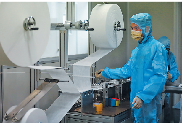
安信纳米口罩生产线。