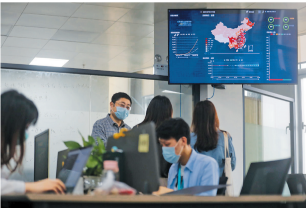
鲸准智慧医疗科技疫情监控图。