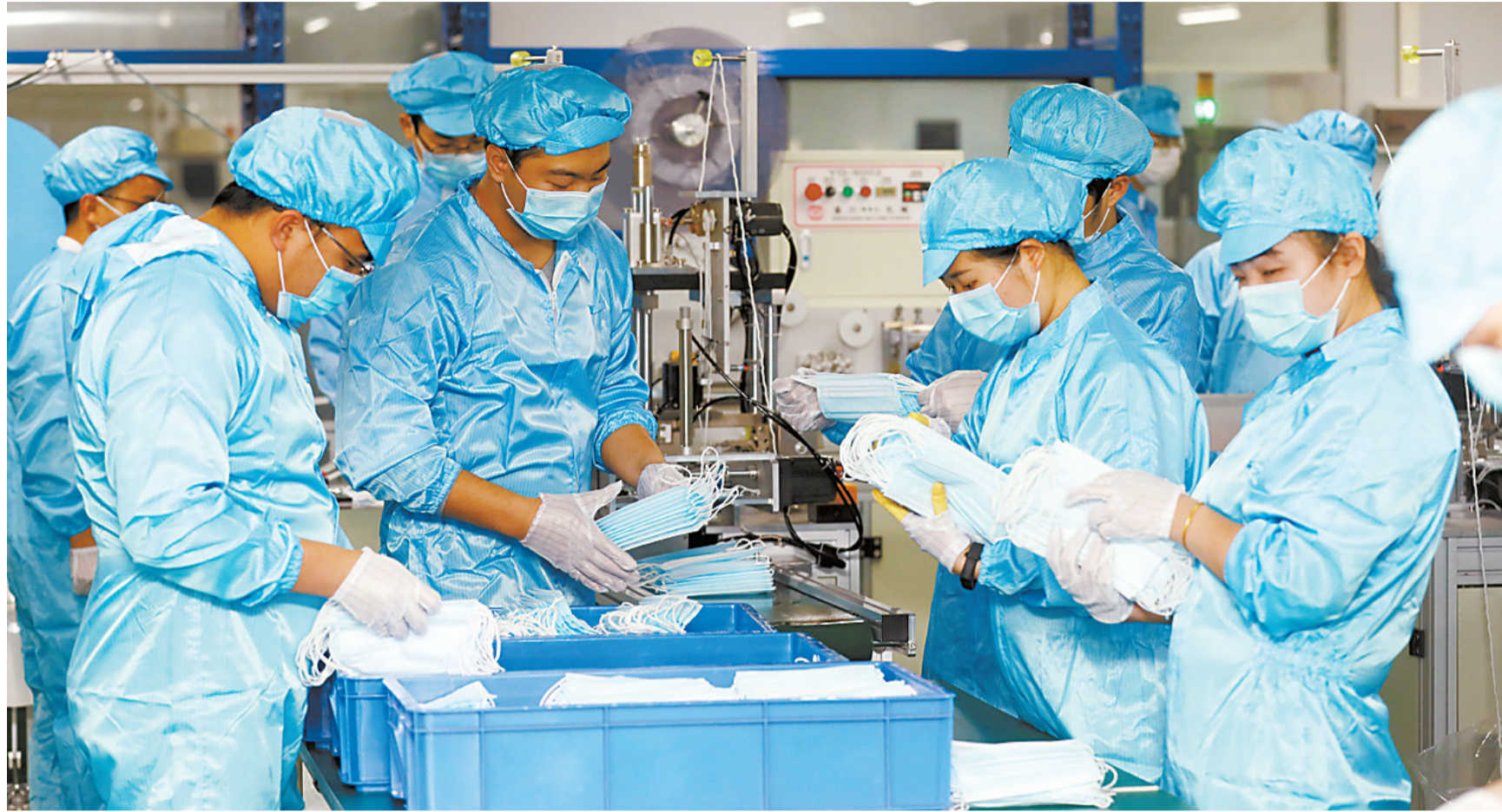
2月21日,格力地产高格口罩一期正式投产。