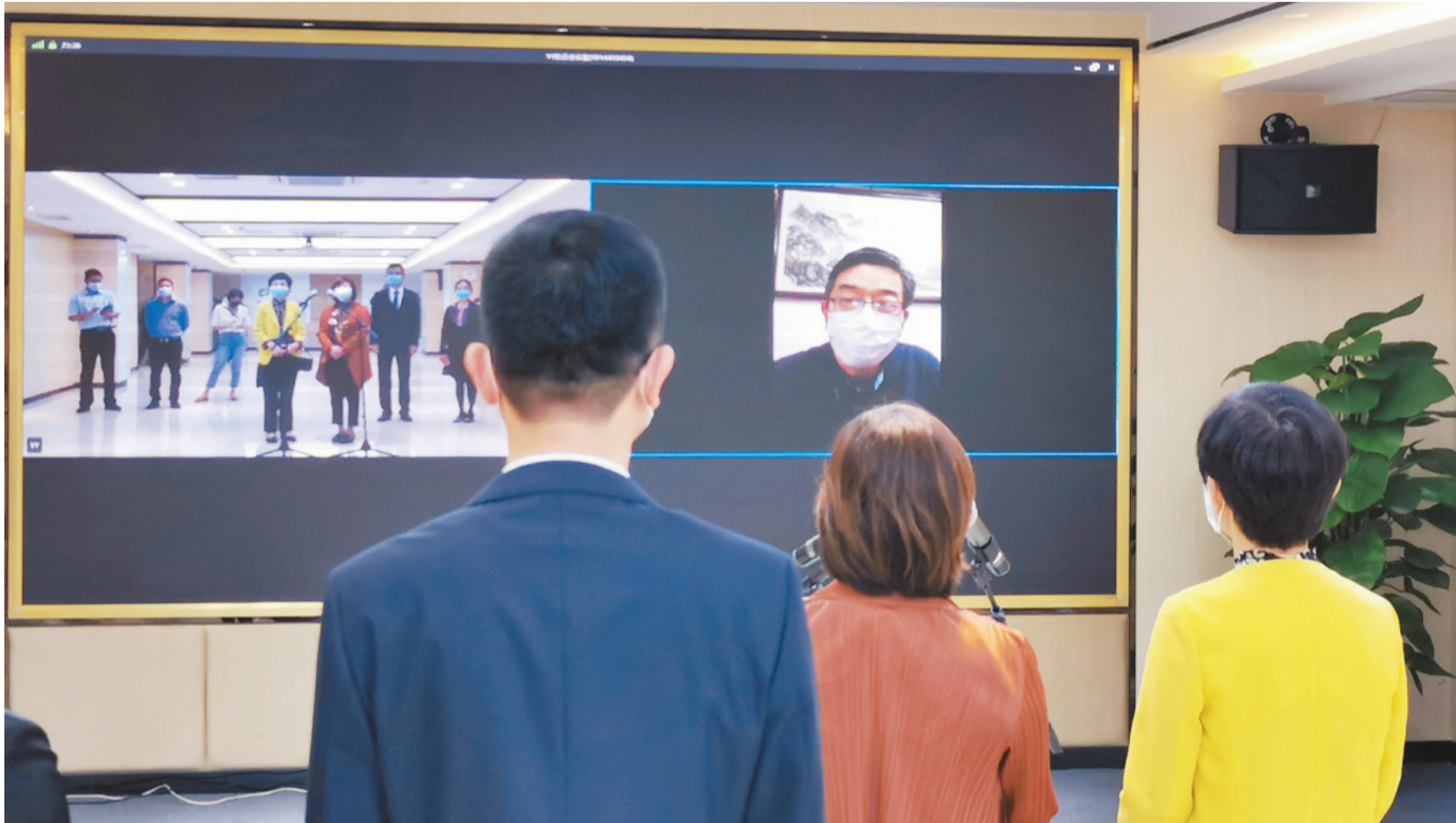
市医保局有关负责人连线慰问在雷神山医院治疗的我市享受附加补充医疗保险“大爱无疆”待遇的新冠肺炎参保人。