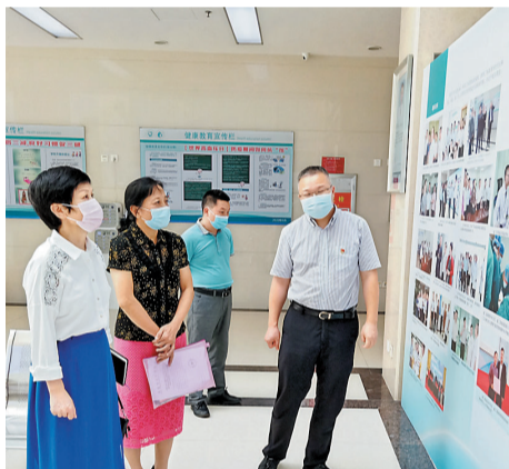
市医保局相关人员到我市医保定点医院了解“互联网+医保”建设情况。