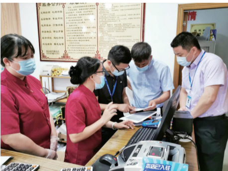
市医保局、市社保基金管理中心工作人员深入定点医院指导落实购买发热、咳嗽药品人员信息登记报送工作。