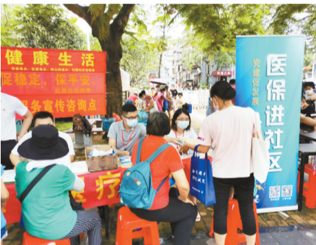
市医保局党员志愿服务队深入社区宣传疫情防控医疗保障政策。