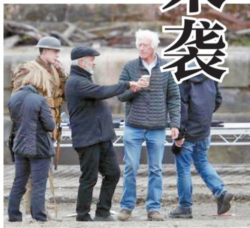
《1917》主创在拍摄现场。戴黑帽的导演萨姆·门德斯(左三)与白头发的摄影师罗杰·迪金斯(右二)。