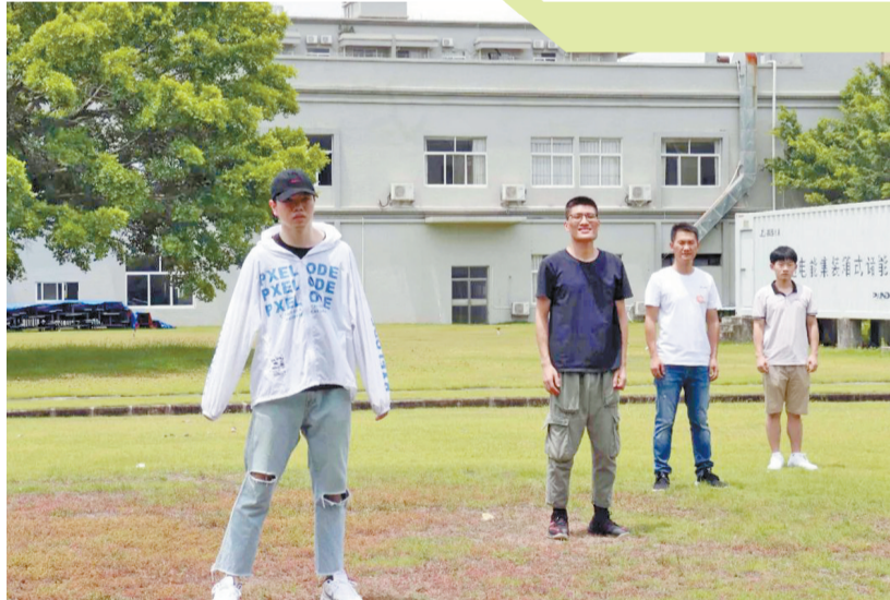
《披荆斩bug的程序员》MV剧照。

本报讯 记者宋显晖报道：“看我弄潮波浪，多认真的亮相，努力跳……看我乘风破浪，多真诚的欲望，努力唱……”借《乘风破浪的姐姐》热播之势，近日，珠海高新区的“程序猿”哥哥创作并出演的《披荆斩bug的程序员》MV在IT圈也火热起来了，许多看过的人都成为小哥哥们圈粉。