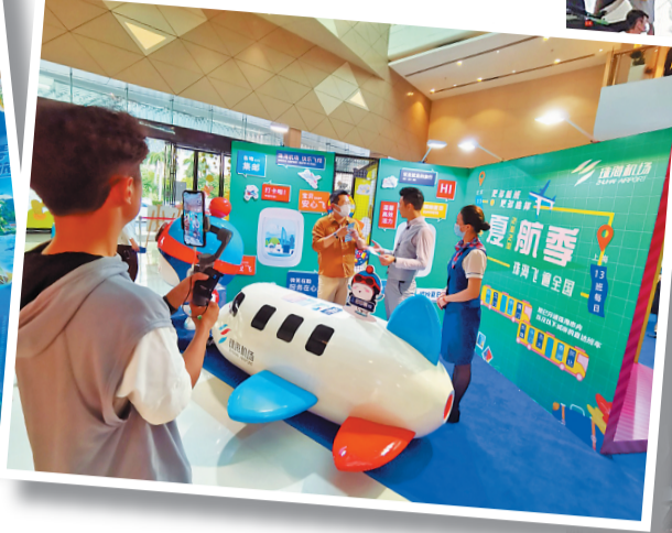
网络媒体线上直播。