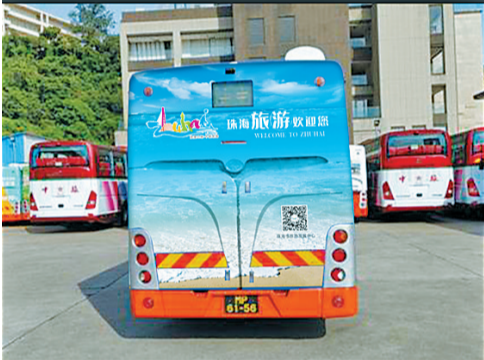
珠海旅游形象在澳门巴士上展示。