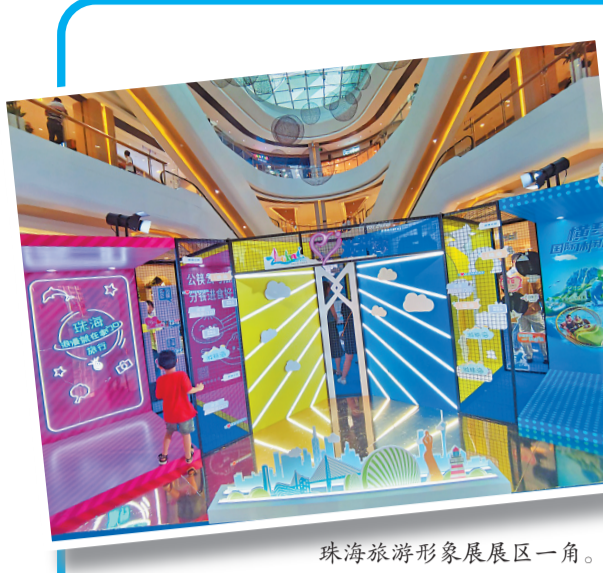
珠海旅游形象展展区一角。