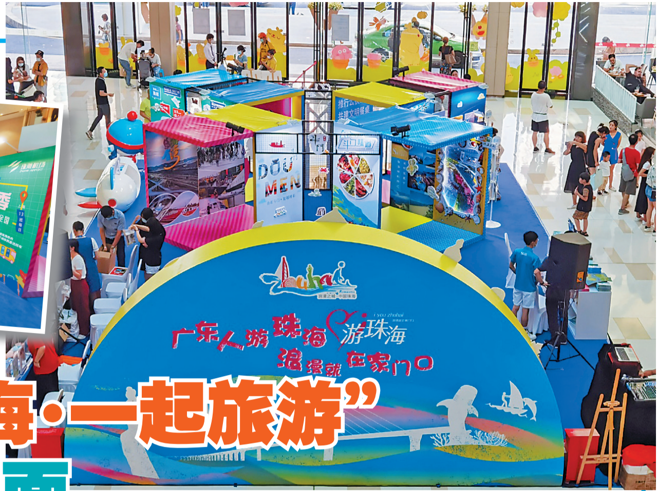
珠海旅游形象展全区景。