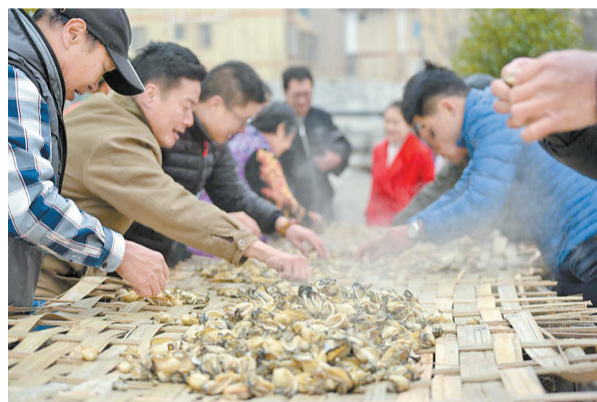
三灶蚝油制作技艺。