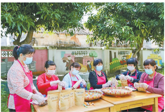
红旗糖厂当年生产的牛轧糖。

本报讯 记者何进报道:日前,金湾区公布了第四批区级非物质文化遗产代表性项目,根据此次公布结果,三灶蚝油制作技艺、三灶陈氏剪纸、小林咸水歌、红旗古法榨糖技艺等4个项目入选金湾区第四批区级非遗名录,项目涵盖传统技艺、传统美术、传统音乐等类别。截至目前,金湾区公布的区级非遗名录共16项。