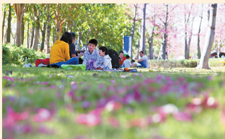
市民在横琴花海长廊下赏花。