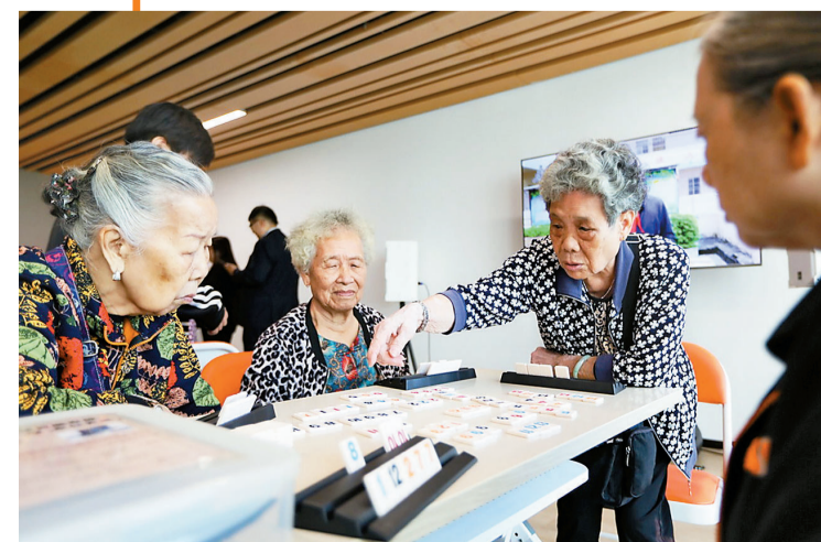
澳门居民在澳门街坊会横琴综合服务中心娱乐。