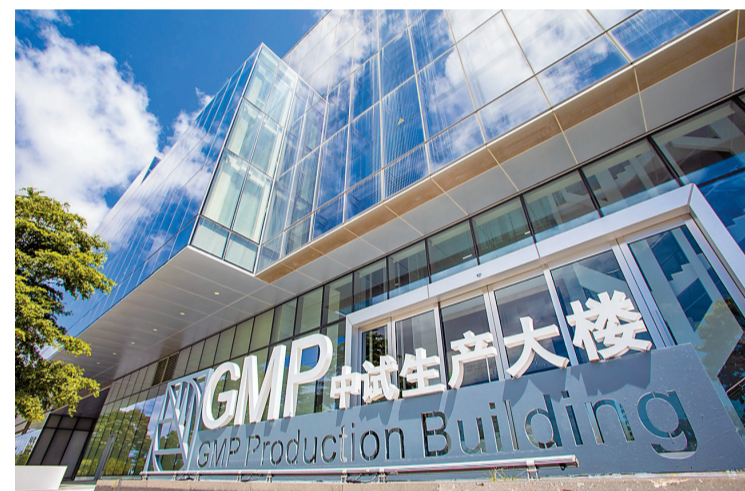
粤澳合作中医药科技产业园。