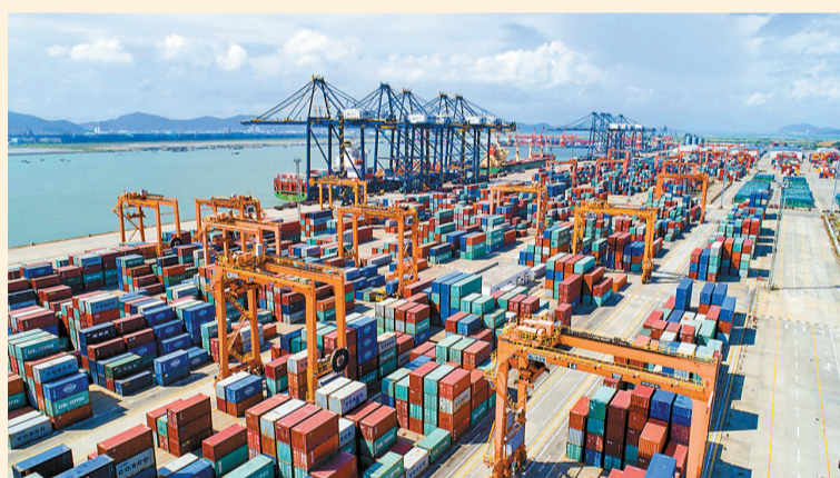
国际货柜码头(高栏)是珠三角西部唯一的天然深水良港。2018年,码头实现货物吞吐量1.28亿吨。