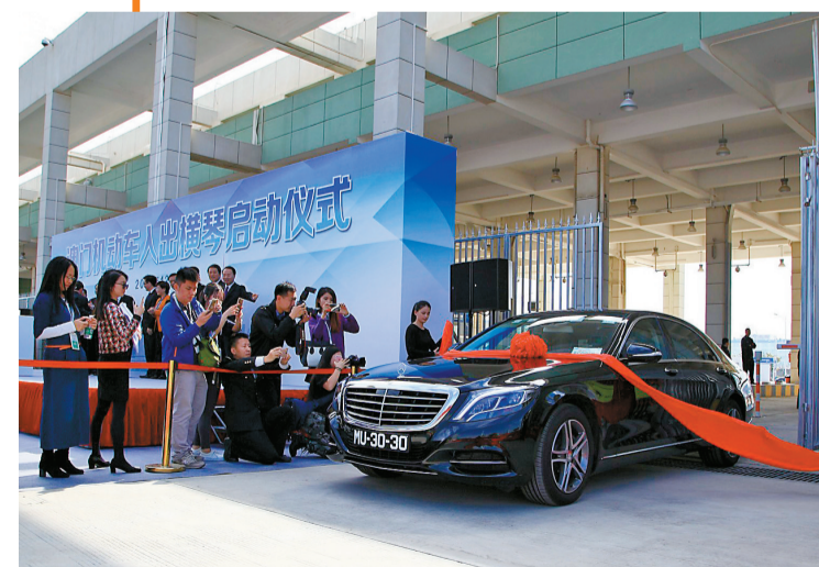
2016年12月20日,澳门机动车入出横琴新规实施,进一步便利了两地人员的往来交流。