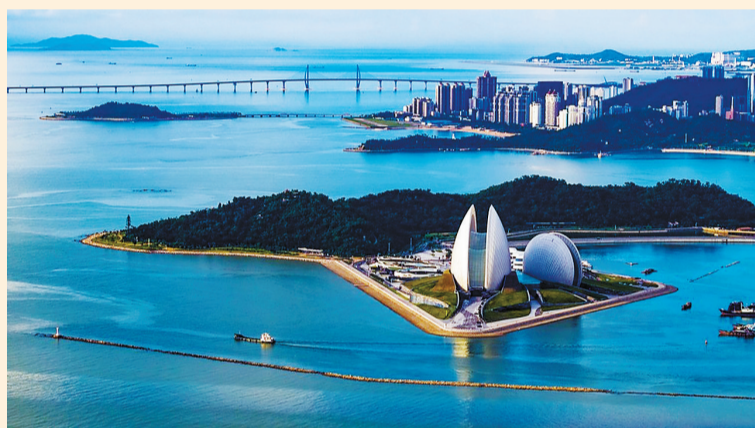
珠海香炉湾,珠海大剧院与港珠澳大桥遥遥相望。