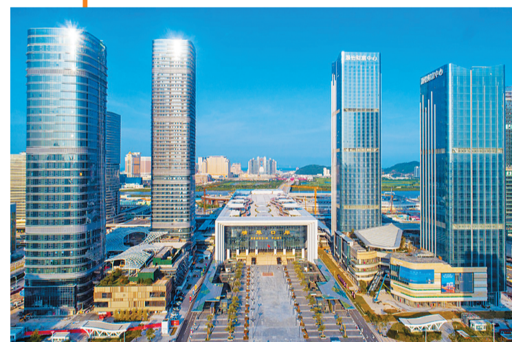
2020年8月18日,横琴口岸新旅检区域正式启用。实行“合作查验、一次放行”的边检查验创新模式。