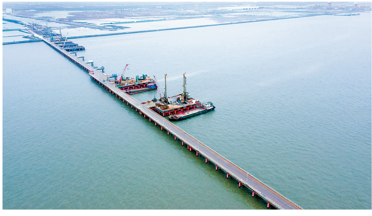
黄茅海跨海通道高栏港大桥柱墩桩基顺利完工。

本报讯 记者陈新年报道:6月29日上午,记者从黄茅海跨海项目建设现场获悉,由广东交通集团投资建设的黄茅海跨海通道项目迎来突破性进展,继5月27日黄茅海大桥3个主塔墩桩基完工后,6月29日高栏港大桥2个主塔墩的钻孔桩也顺利浇筑完成。至此,在196天内,两座大桥5个主塔墩的164根桩基浇筑施工全部完成,比原计划提前两个月。黄茅海跨海通道两座主桥的施工从水下桩基施工转入水上主塔承台施工阶段。