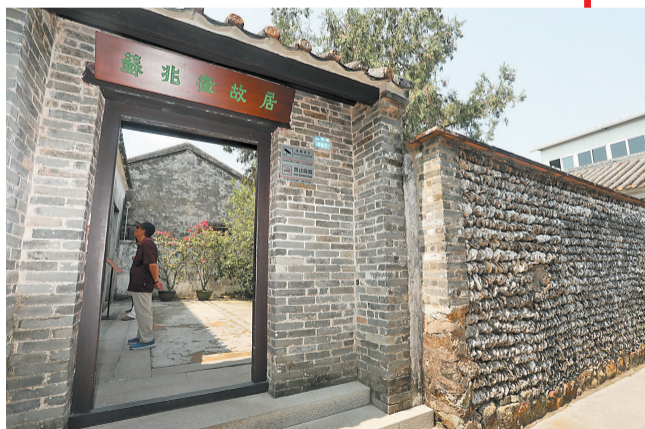
苏兆征故居陈列馆。