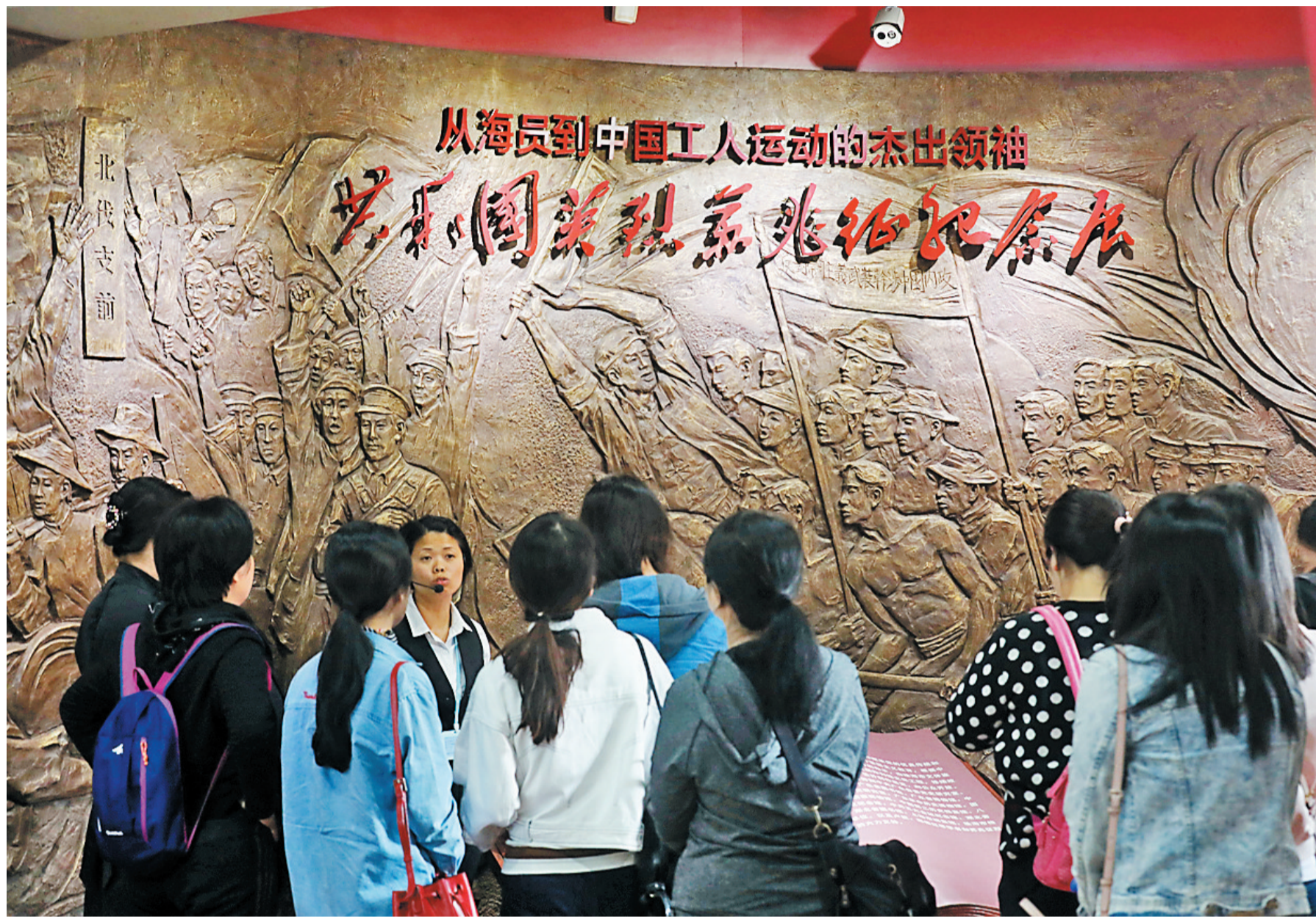
市民参观苏兆征纪念馆。