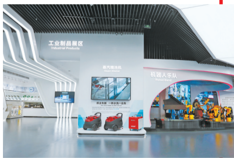
格力电器工业制品展区。