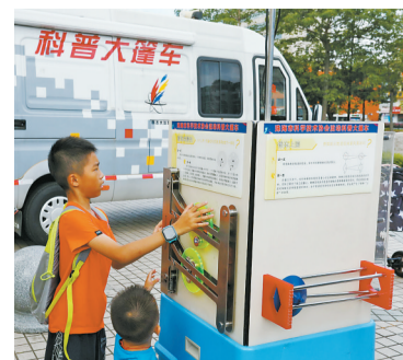
珠海市全国科技活动周防灾减灾日活动现场。

派诺科技成立于2000年,总部位于高新区,公司以“智慧用电、绿色用能”为使命,基于配电、能源、设备和后勤管理四大专业领域,以自主研发的智能设备、边缘网关、软件平台等产品为核心,提供能源物联网解决方案。2019年,派诺科技党委被列入珠海市非公经济组织基层党建示范点培育点。 据了解,党史学习教育开展以来,市科技创新局主动与高新区创新创业服务中心党支部、人民医院第14党支部、派诺科技有限公司党委等多家珠海科技创新主体党组织结对共建单位,推动形成强强合作、资源共享、优势互补、合作共赢的党建工作新格局。 此外,市科技创新局下属事业单位市生产力促进中心也与东风社区党支部达成长期共建协议。今年以来,双方联合开展了社区志愿服务、垃圾分类宣传、小区种树栽花、核酸检测志愿服务、“民生微实事”科技文献电子书进社区等活动。