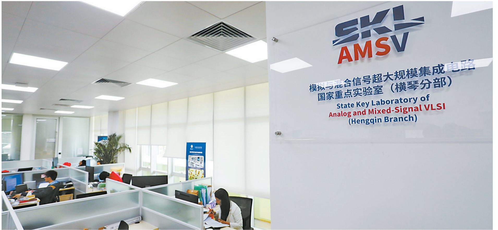
珠海澳大科技研究院模拟与混合信号超大规模集成电路国家重点实验室(横琴分部)。