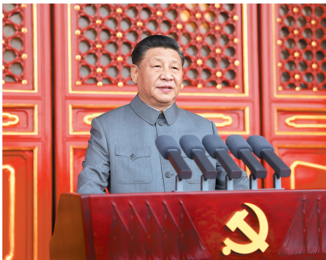
7月1日,庆祝中国共产党成立100周年大会在北京天安门广场隆重举行。中共中央总书记、国家主席、中央军委主席习近平发表重要讲话。

习近平发表重要讲话强调 一百年前,中国共产党的先驱们创建了中国共产党,形成了坚持真理、坚守理想,践行初心、担当使命,不怕牺牲、英勇斗争,对党忠诚、不负人民的伟大建党精神,这是中国共产党的精神之源。一百年来,中国共产党弘扬伟大建党精神,在长期奋斗中构建起中国共产党人的精神谱系,锤炼出鲜明的政治品格。历史川流不息,精神代代相传。我们要继续弘扬光荣传统、赓续红色血脉,永远把伟大建党精神继承下去、发扬光大 李克强主持 栗战书汪洋王沪宁赵乐际韩正王岐山胡锦涛出席