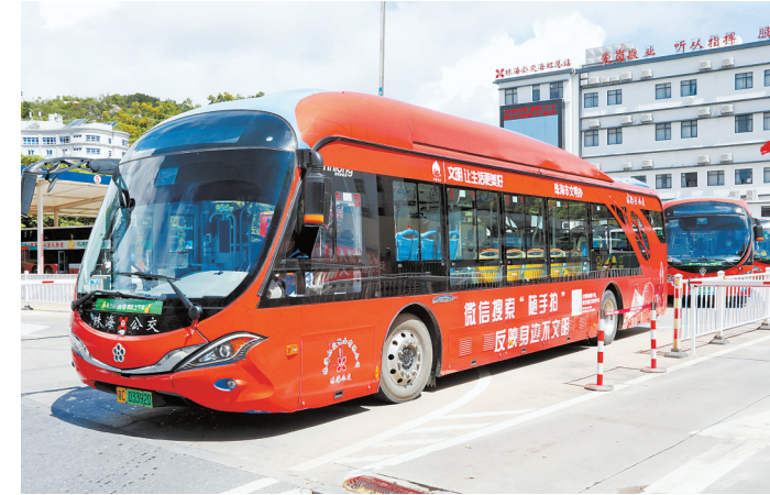
公益宣传公交车“小橙子”外形抢眼。

路文明”等公益标语,为深化全国文明城市建设营造浓厚的氛围。 上午10时,装扮一新的车辆驶离公交海虹总站,沿着情侣路向前行驶,靓丽的外观吸引了许多市民的目光。 公交司机蓝师傅说:“公交车作为一道流动的风景,可以担当文明传播者的角色,开着这辆车行驶在街头,醒目的标语不仅能让更多市民看到,也能为城市增添一抹亮色。” 据了解,印有公益宣传标语的公交车共有20辆,分别为3路、7路、9路、B6路、K10路等公交线路。从9月3日起,这20辆装扮一新的公交车将把文明新风传递到全市的大街小巷。