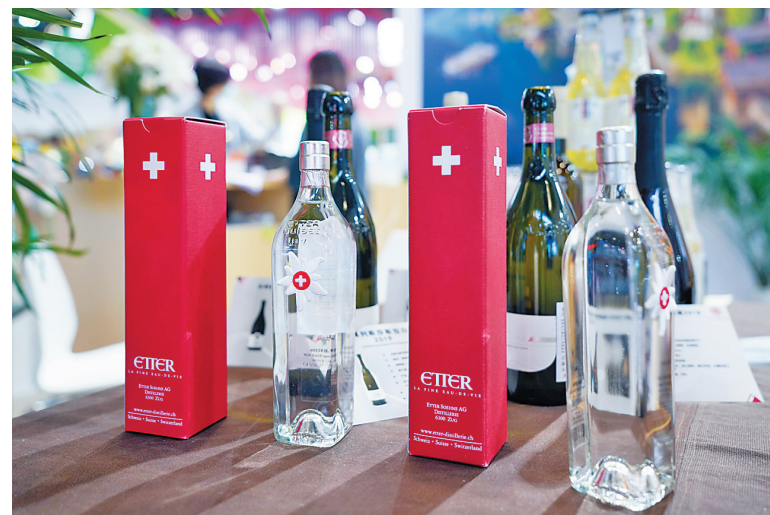
9月5日在服贸会国家会议中心国别展区瑞士展台拍摄的酒类展品。

新华社北京9月5日电 为培育国际消费中心城市,北京市商务局5日发布《北京培育建设国际消费中心城市实施方案》,这是记者从服贸会“2021北京国际消费中心城市论坛”了解到的信息。