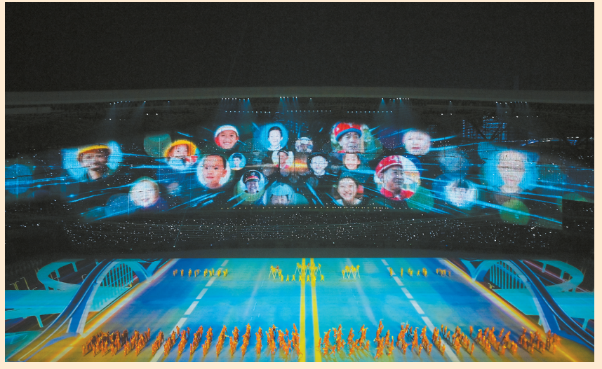
演员在开幕式现场表演。