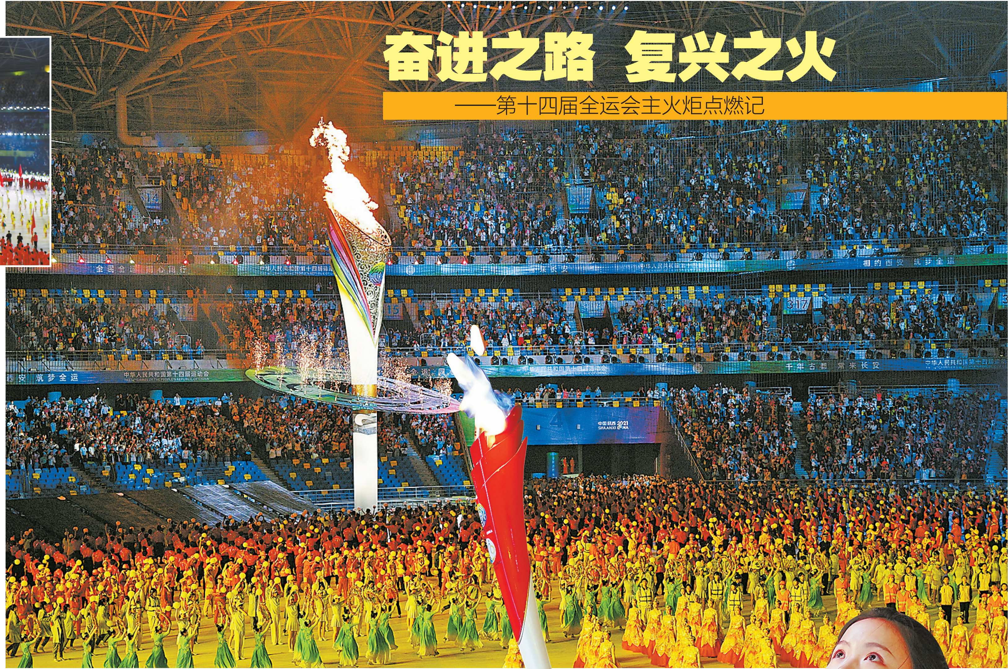
主火炬被点燃。

15日21时27分许,在华夏文明重要发祥地之一、红色热土陕西的西安奥体中心体育场,灯光璀璨、掌声雷动。欢腾的场内倏忽间有光亮闪动,火苗跳跃宛若精灵。 全场陷入寂静。火苗不断生长为烈焰,首位握持主题火炬“旗帜”出现在体育场的,是在东京奥运会上为国争光的短跑运动员苏炳添。数十米的距离,从一个多月前在东京新国立竞技场的飞驰如电,到如今在“长安花”的步伐沉稳,快慢之间彰显中国健儿张弛有度。 跑道上、泳池中,第十四届全运会主场西安奥体中心是本次盛会田径、游泳两个大项的赛场,“中国飞人”苏炳添停住脚步,点燃游泳名将张雨霏手中的“旗帜”。交接之间,曾分别向世界展示“中国速度”的两人目光坚定、面带笑容,向四周欢呼的观众挥手致意。 随后,在聚光灯的追逐照耀下,从张雨霏手中点燃火炬的秦凯好似不可阻挡的秦军士大步流星。他与第四棒火炬手郭文珺实现两位陕西籍奥运冠军的互动,也成为圣火生命历程的缩影:7月17日的圣地延安星火广场,郭文珺与残奥会冠军翟翔共同采集火种,让革命圣地的星星之火再次因红色气质获得世人关注;8月16日的古城西安永宁门外,秦凯背对巍巍古城城高擎“旗帜”,担任第一棒火炬手,开启了这股强大信心的接力传承。 与郭文珺交接,乒乓球大满贯得主马龙斗志昂扬,步伐轻快,在亿万双眼睛的注视下,用“旗帜”引领“旗帜”,将最后一棒火炬手的使命交给了射落东京奥运会首金的“00后”选