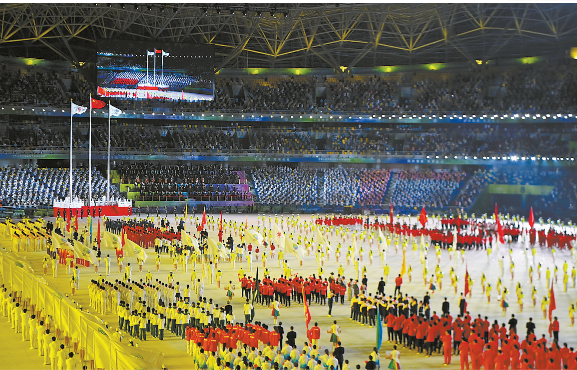
中华人民共和国国旗、中华人民共和国运动会会旗、第十四届全国运动会会旗在开幕式现场飘扬。