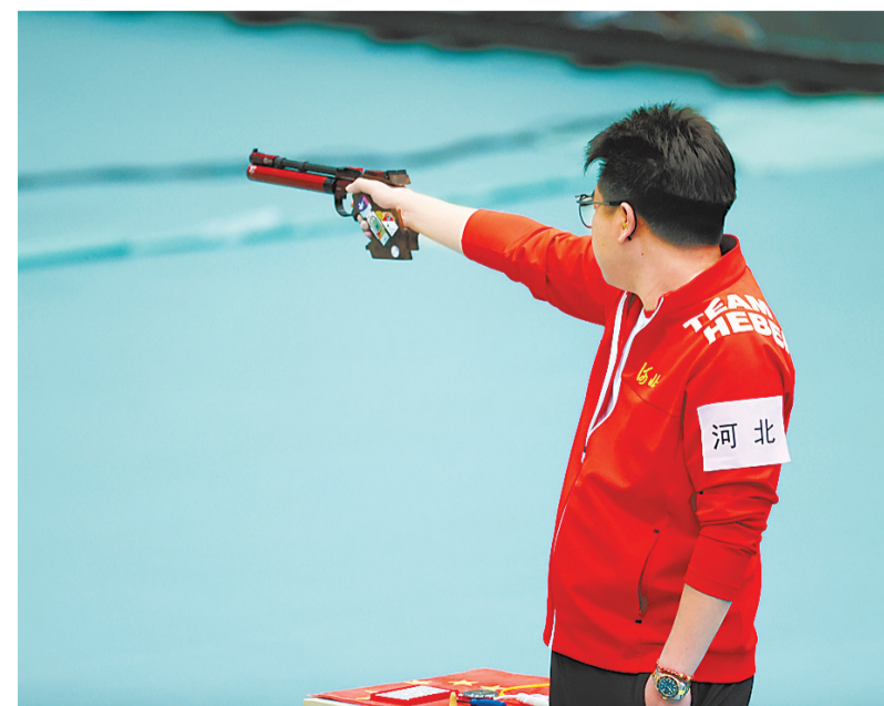
“老枪”庞伟在比赛中。