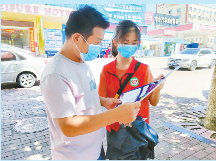
金湾区志愿者走上街头倡导市民爱护环境、文明出行。