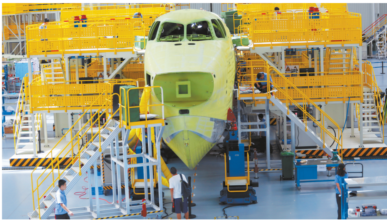
在金湾区珠海航空产业园中航通飞华南飞机工业有限公司,AG600飞机1003架机在进行总装作业。