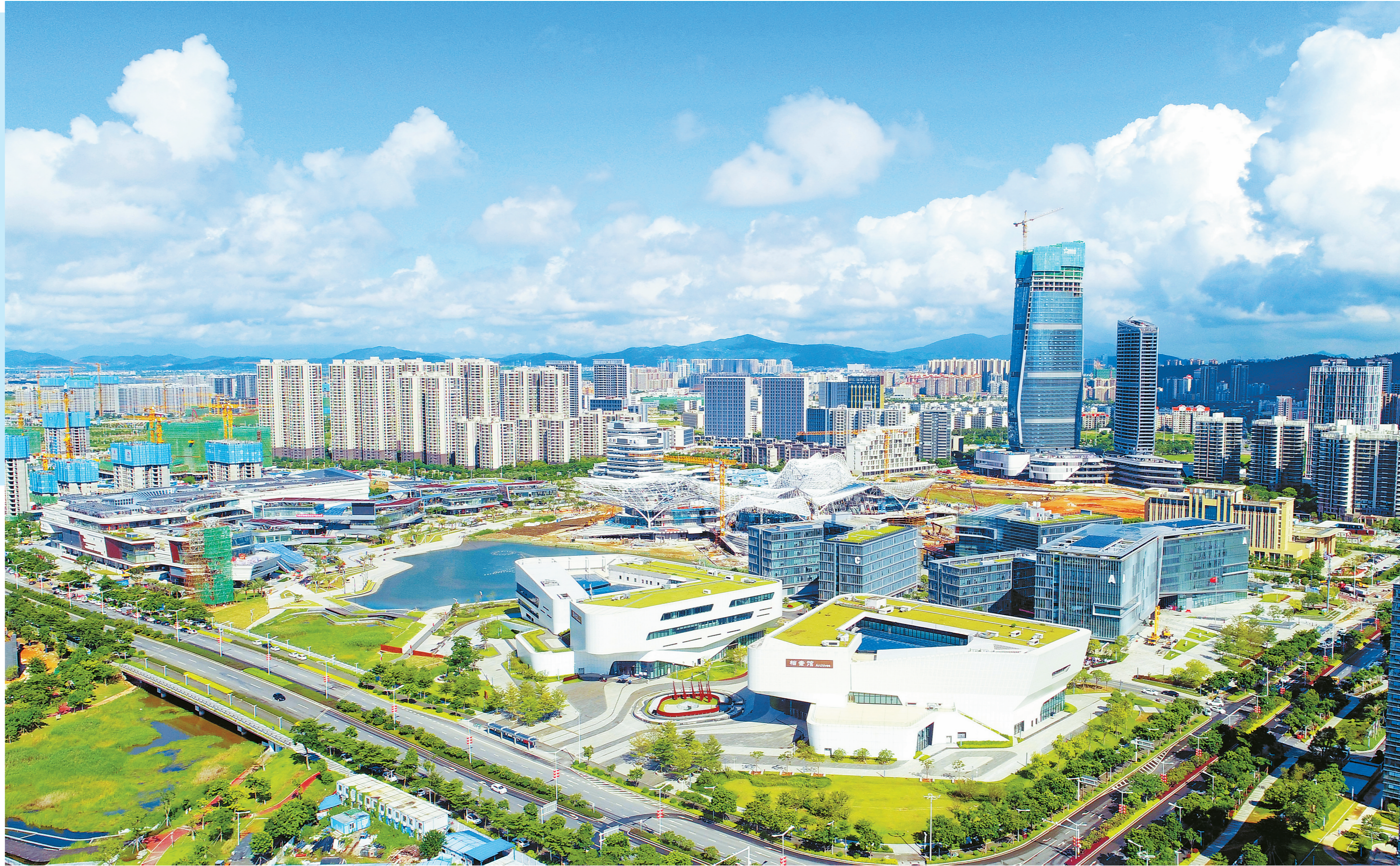
日新月异的金湾区航空新城。

为办好航展相关准备工作,金湾区正加快推进航展P6、P7、P8停车场,海渔路临时扩建及增设海渔路交机场东路口交通信号灯等建设。此外,珠海机场综合交通枢纽也已正式开工。未来,珠海机场将新增大巴车场站、出租车站及商业服务配套,并建成珠海机场现代化综合体,为旅客的出行提供更大的便利。而机场以外的相关配套,也将成为拉动经济发展的新动能。立体化的交通网络,将与鹤洲高铁枢纽等一系列重点项目实现新的联结,将金湾区“双港”的优势进一步放大。