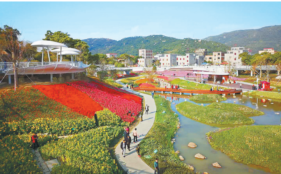
美丽如画的木头冲村。

然而,仅依靠城市建设,无法撑起城市的完整形象,提高城市品质,深化推进文明城市长效建设同样重要。为此,金湾区直面堵点顽疾,开展“三线”整治,亮出城市“天际线”;创新手段,整治“牛皮癣”;全面整治提升市容环境,倡导城市文明新风;下足“绣花”功夫,做活“精”字文章,协调推进城市“面子”与“里子”齐提升,打造“文明航展”新风貌。