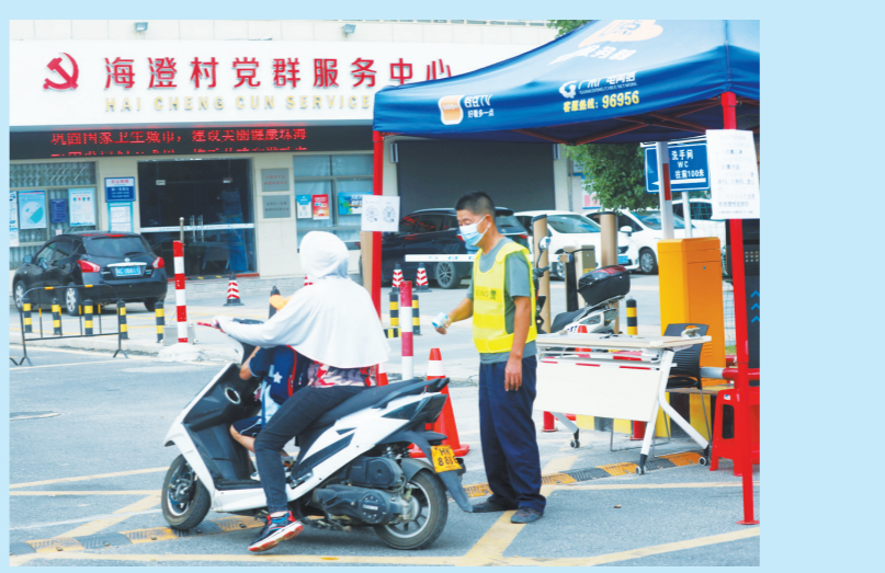
9月16日,海澄村村口,工作人员在对进村人员进行防疫检查。