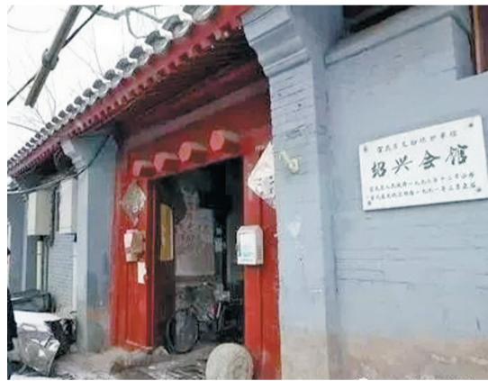
北京绍兴会馆是《狂人日记》诞生地。资料图片

新华社北京9月21日电 北京市西城区于20日发布第二批文物建筑活化利用计划,面向社会公开推出活化利用文物建筑项目10个。包括杨椒山祠、绍兴会馆、宣兴会馆、护国观音寺(本体)、五道庙、钱业同业公会、梅兰芳故居、云吉班旧址和朱家胡同45号茶室9处文物建筑和1个向社会公开招募运营服务机构的项目京报馆。