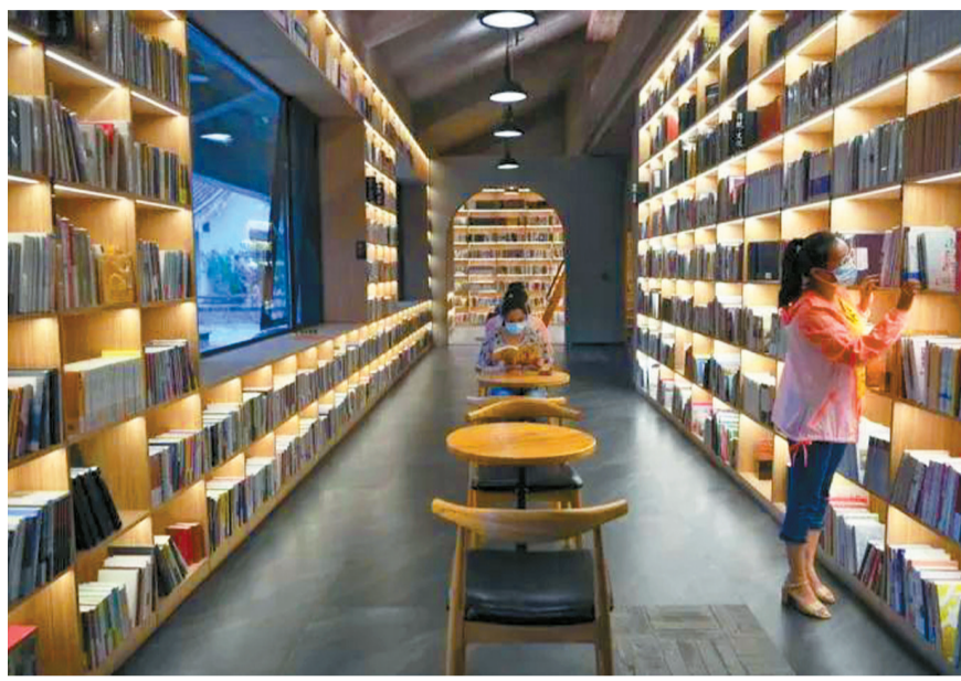
北京京杭大运河书院。

遍布大街小巷的实体书店,成为城市的文化地标、人们的心灵灯塔。一段时期以来,受到互联网迅猛发展挤压的实体书店又面临疫情防控常态化下的发展难题,如何走出困境、重现生机?