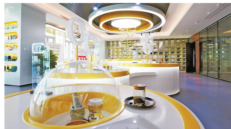
粤澳合作中医药科技产业园。