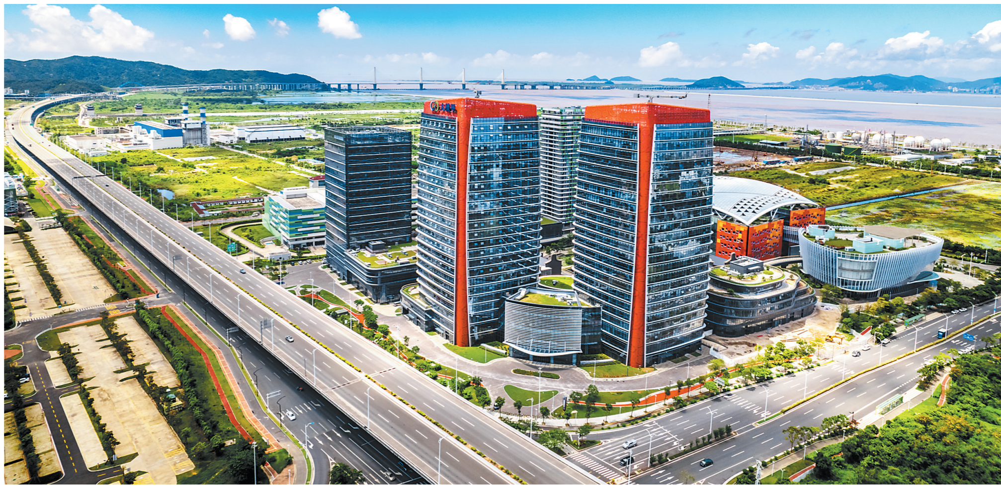
横琴国际科技创新中心和粤澳集成电路设计产业园。