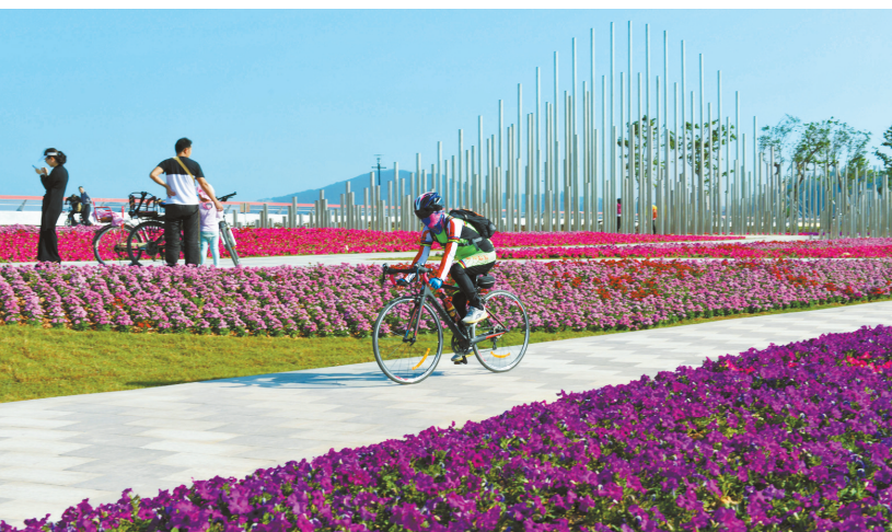
居民骑行在美丽的金湾路上。

“截至目前,通达金湾区各工业园的公交线路已达23条,投入车辆118台,基本实现主要工业园区和高栏港综合保税区公共交通全覆盖。”金湾区交通运输局相关负责人透露,接下来将进一步优化公交线路设计及班次安排,着重向工业园区、偏远乡村延伸公交服务,不断提升公交服务质量。