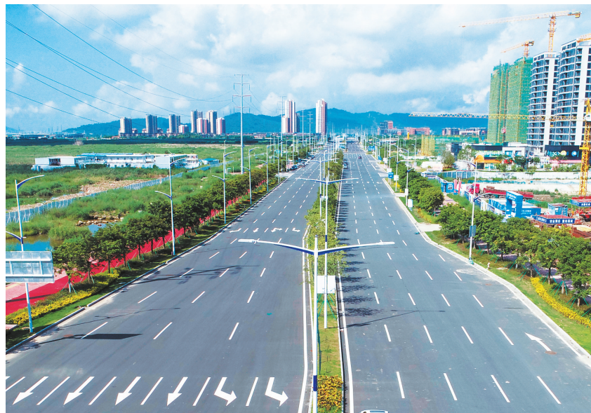
今年8月底,金湖大道全线通车。