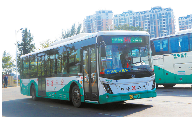
多条公交线路优化延伸至航空新城。