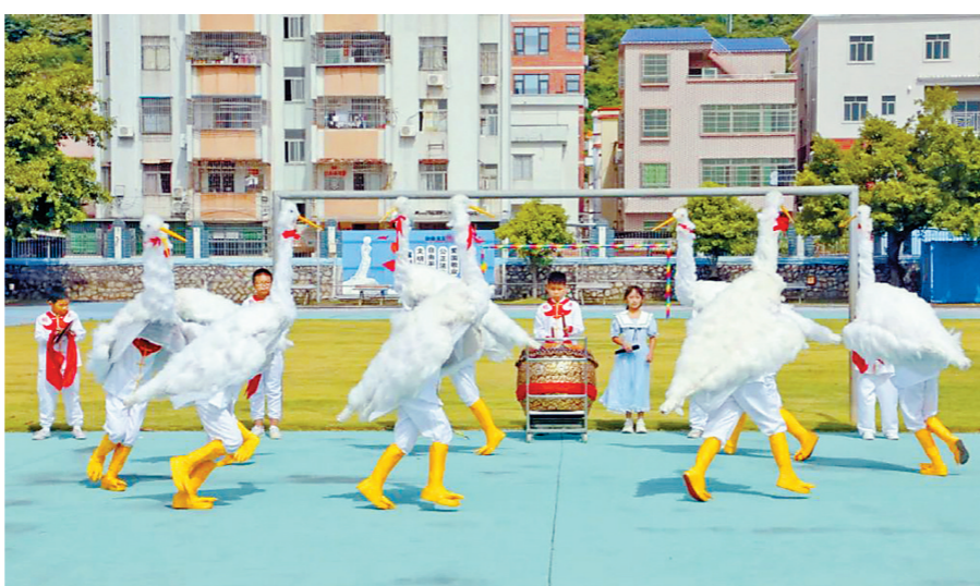
海澄小学学生在排练三灶鹤舞。