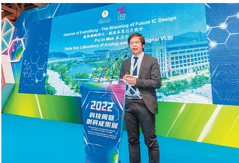
2021年度科研项目结题展暨学术报告会。

在路演对接会上,科研项目团队通过路演及会面洽谈,与来自广东、山东及海南等省份的60多家创新主体进行对接。在超过140场会面洽谈后,双方普遍表示有意后续深入了解,现场还签订了32组合作意向书。通过连场精彩的科普及洽谈活动,配合四大展区共计将近两百个内容丰富多元的展位,本届科技周顺利地成为澳门的