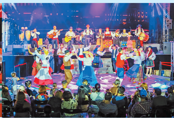
葡语乐团轻音乐演出。