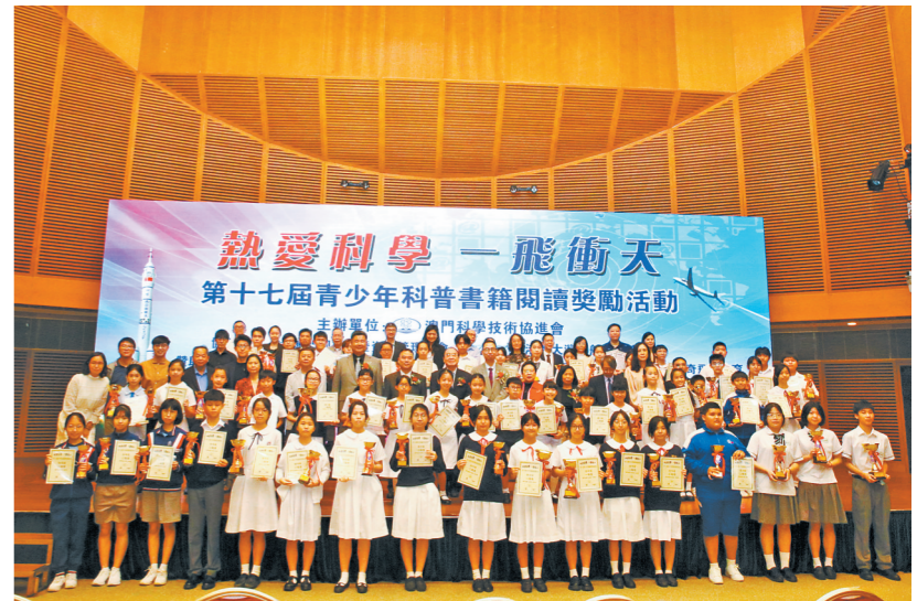
第十七届“澳门青少年科普书籍阅读奖励活动”颁奖典礼在澳门科学馆举行。

本报讯 记者钟夏 实习生李美琪报道:第十七届“澳门青少年科普书籍阅读奖励活动”颁奖典礼近日在澳门科学馆举行,现场共颁发一等奖9名、二等奖15名、三等奖30名、优秀辅导教师奖3名及团体奖两项。