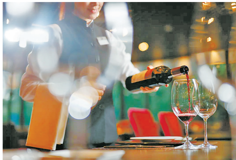
葡萄酒品酒体验活动。

一连3日的“葡韵嘉年华”均载歌载舞,圆形剧场大舞台带来别具葡语特色的音乐、歌舞,嘉模教堂前地的小舞台提供葡语乐团轻音乐演出,首间森巴学校沿途表演劲歌热舞,悠扬乐韵传遍整个龙环葡韵及嘉模区。