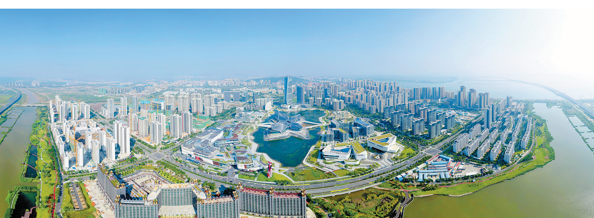
珠海西部城市核心区——航空新城。