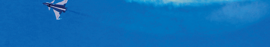
本届中国航展精彩的飞行表演让现场观众大呼过瘾。