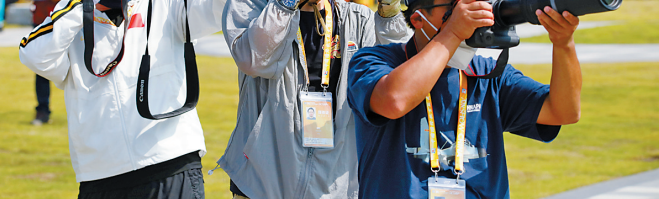
新近完工的金凤台山顶休闲公园,供摄影爱好者在此用“长枪短炮”捕捉航展精彩瞬间。