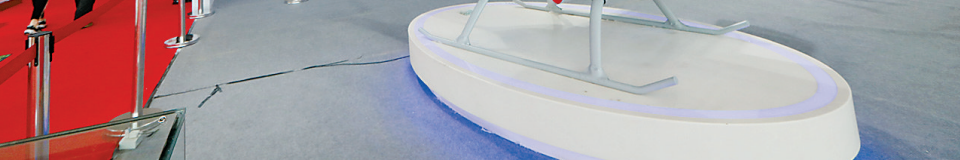
“金湾智造”隆华无人直升机。