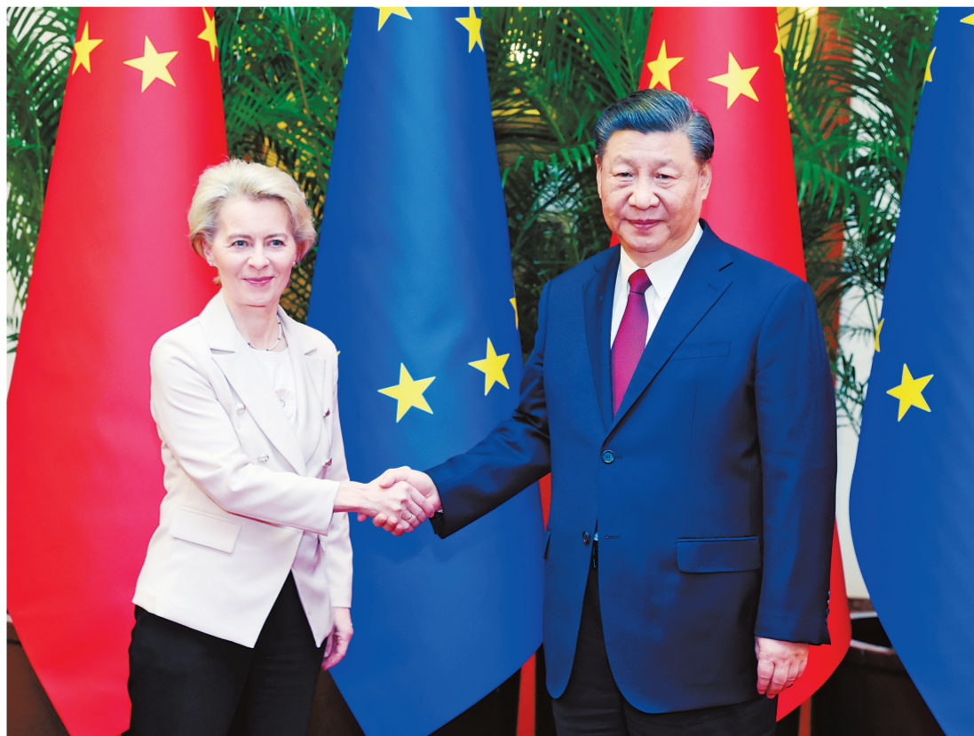
4月6日下午，国家主席习近平在北京人民大会堂会见欧盟委员会主席冯德莱恩。

新华社北京4月6日电 4月6日下午，国家主席习近平在人民大会堂会见欧盟委员会主席冯德莱恩。