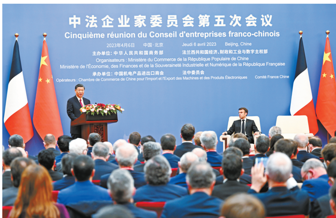
4月6日下午，国家主席习近平在北京同法国总统马克龙共同出席中法企业家委员会第五次会议闭幕式并致辞。

新华社北京4月6日电 4月6日下午，国家主席习近平在北京同法国总统马克龙共同出席中法企业家委员会第五次会议闭幕式并致辞。