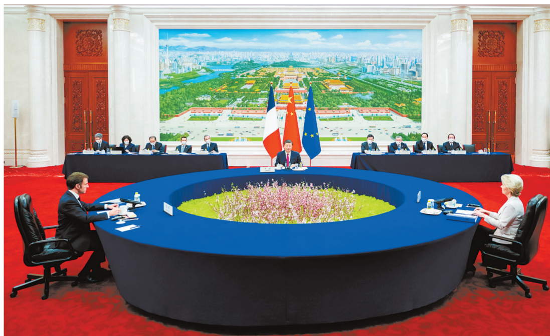
4月6日下午，国家主席习近平在北京人民大会堂同法国总统马克龙、欧盟委员会主席冯德莱恩举行中法欧三方会晤。

新华社北京4月6日电 4月6日下午，国家主席习近平在人民大会堂同法国总统马克龙、欧盟委员会主席冯德莱恩举行中法欧三方会晤。