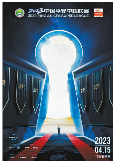
中超联赛新赛季海报。

2023赛季是中国职业足球联赛开启的第30年,也是中超联赛诞生后的第20个赛季。本赛季中超联赛将进行30轮240场较量。本赛季中超共有6次一周双赛。第一次双赛是4月25至26日进行的第3轮,随后5月9日至10日的第6轮、5月23日至24日的第9