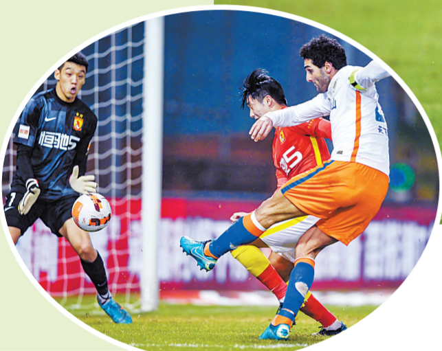
山东泰山队(白)新赛季努力争冠。