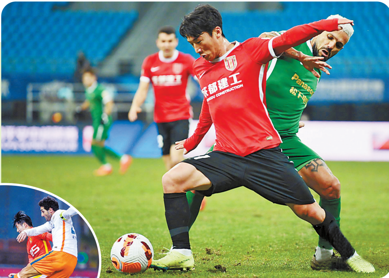
浙江队(右)和成都蓉城队成为“搅局球队”。

一座火神杯铭刻着十九个赛季的过去,也带领着我们共创新未来。在职业联赛开启后的第三十年,在中超联赛诞生后的第二十个赛季,向赛场走去,向我们走来,有你的未来,生生不息。