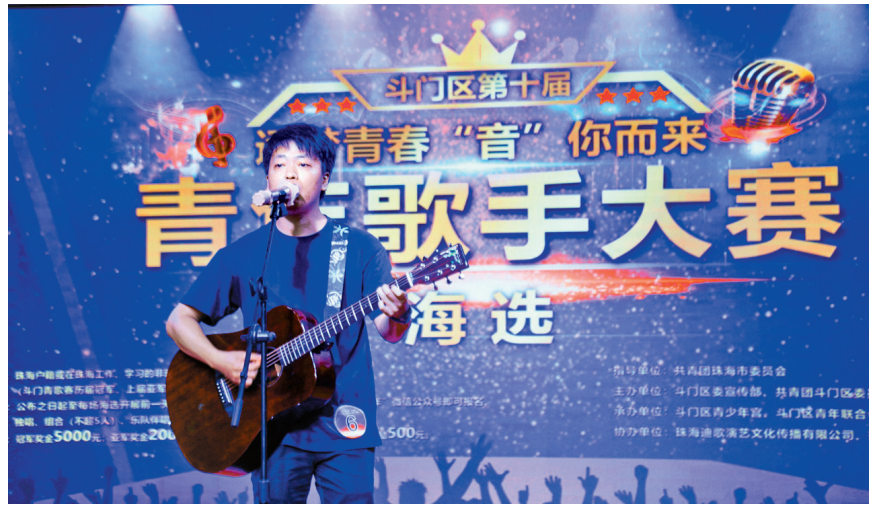
参赛选手正在演唱。

本报讯 记者陈怡葵报道:4月15日至16日,斗门区青少年宫展演厅内歌声飞扬,300多名青年选手用歌声拉开“逐梦青春,‘音’你而来”斗门区第十届青年歌手大赛帷幕。经过激烈角逐,共有40名选手进入初赛。初赛将于4月22日举行。