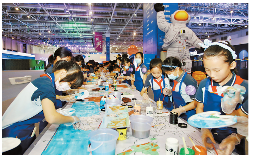
4月24日,少年儿童在百米长卷上共绘航天梦。

本次活动以“格物致知 叩问苍穹”为主题,主要安排百米长卷共绘航天梦暨《中国插画艺术展》少儿航天主题作品全国征集启动仪式、连线央视“云”看2023年“中国航天日”启动仪式暨中国航天大会开幕式、太空大讲堂第二期“张可可教授科普讲堂”、珠海太空中心首席科普导师李锐线上直播等环节。