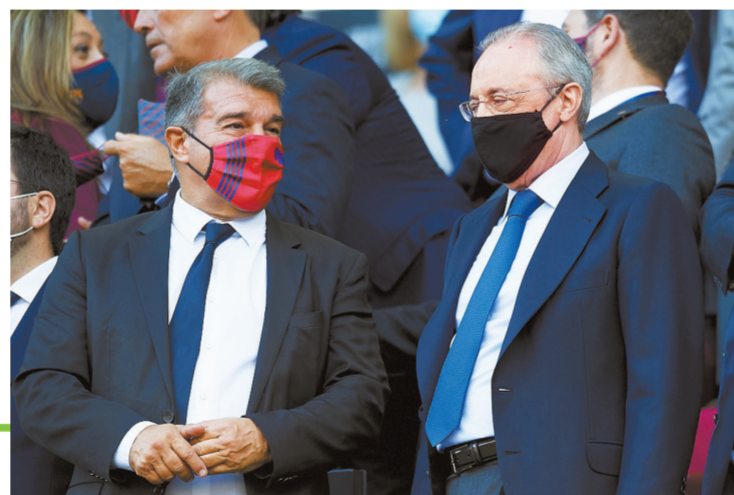
巴萨主席拉波尔塔和皇马主席弗洛伦蒂诺。