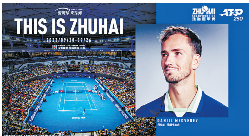
梅德韦杰夫期待首次在横琴国际网球中心展示球技。

对于赛事时隔四年重回珠海,华发体育总经理兼执行董事吕品德表示,作为粤港澳大湾区唯一的ATP巡回赛,赛事有得天独厚的区位优势。作为赛事的执行者,华发体育将以高规格、高要求的办赛标准,将赛事打造成为ATP巡回赛的高水平赛事。