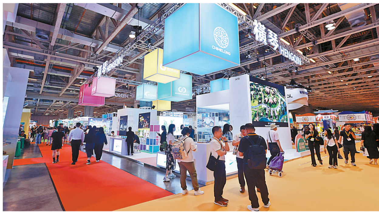
第11届澳门国际旅游(产业)博览会近日开幕,横琴文旅项目倍受关注。

本报讯 记者张伟宁报道:第11届澳门国际旅游(产业)博览会(以下简称“澳门旅博会”)近日在澳门威尼斯人金光会展中心开幕。作为本届澳门旅博会的协办单位,横琴粤澳深度合作区组织8家横琴文旅企业设展,展示横琴营商环境、文旅政策及项目。