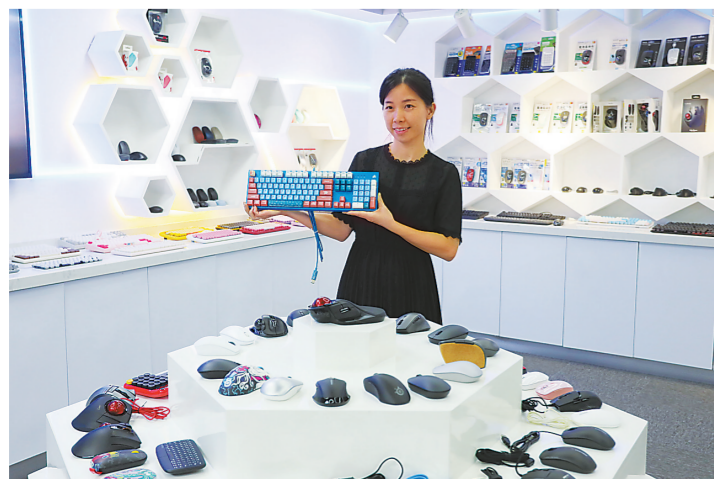
智迪科技产品展示厅。

可以预见的是,在创新的驱动下,资本市场上的“珠海军团”将进一步发展壮大,助推珠海经济高质量发展跑出“加速度”。