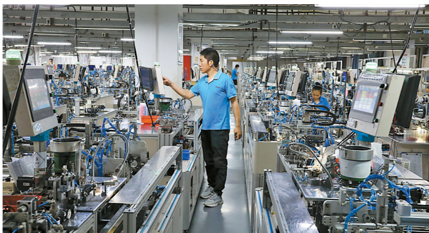
科瑞思科技生产车间。