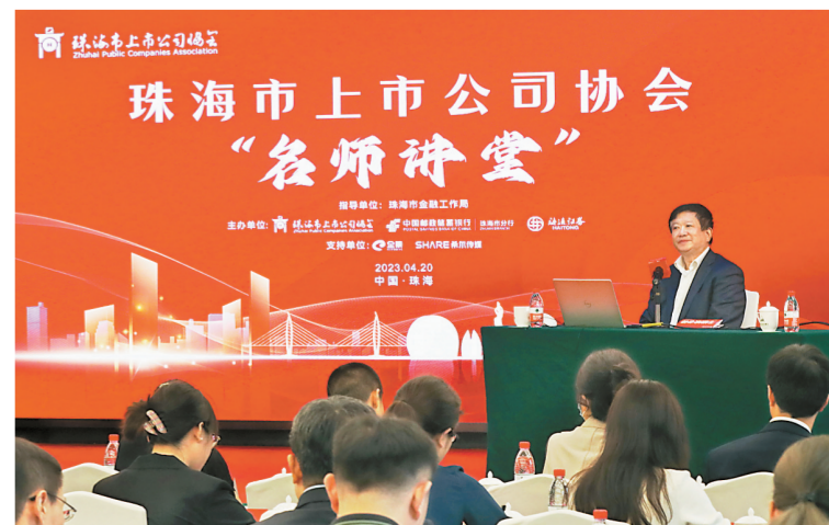
珠海市上市公司协会举办“名师讲堂”活动。