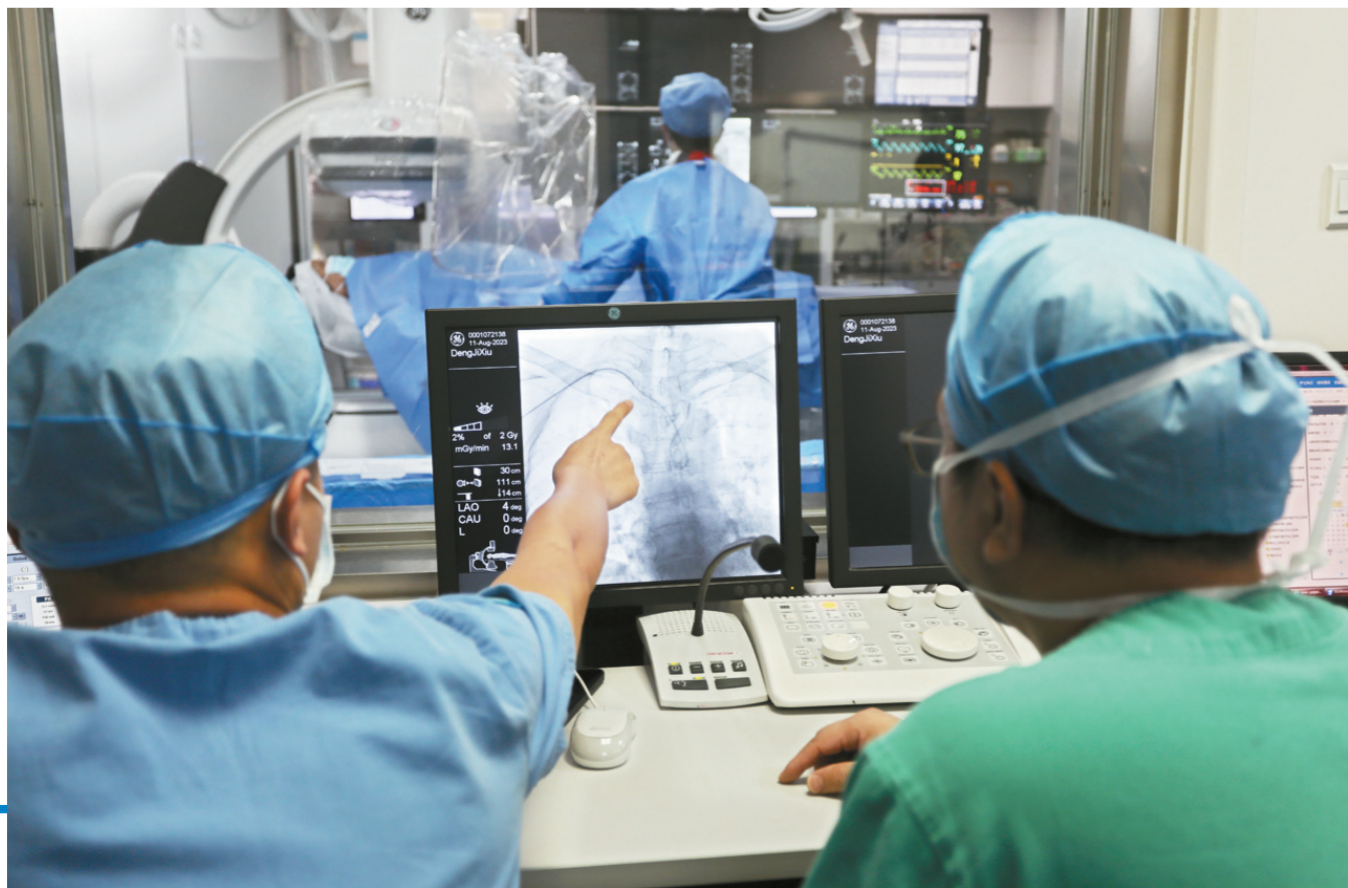
医师团队合力为患者做手术。