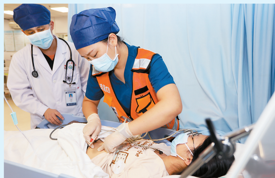
急诊医生了解患者病情。