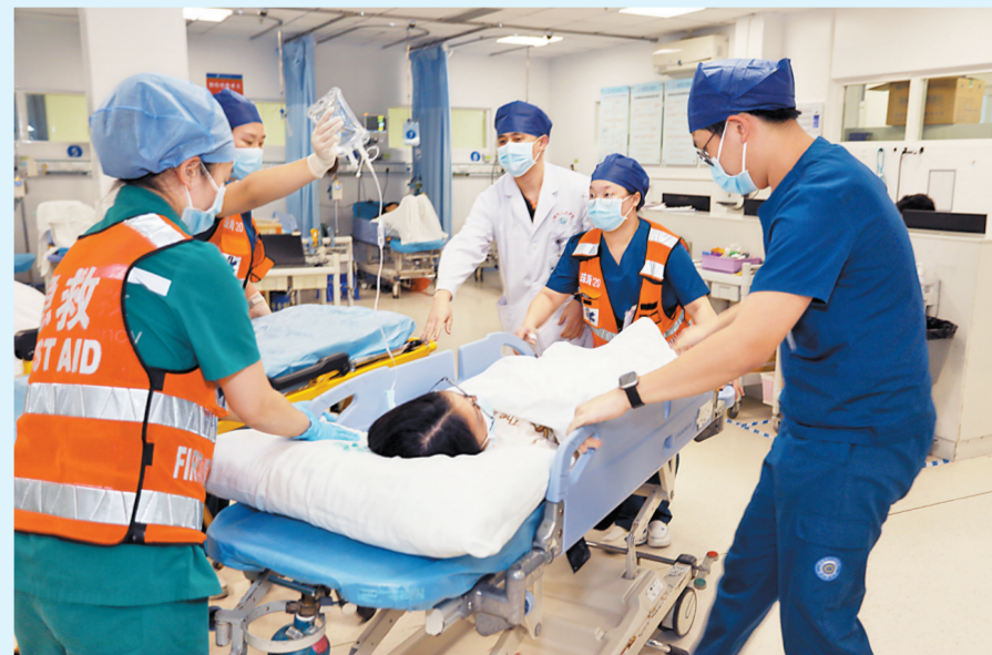
医护人员紧急处置急诊患者。