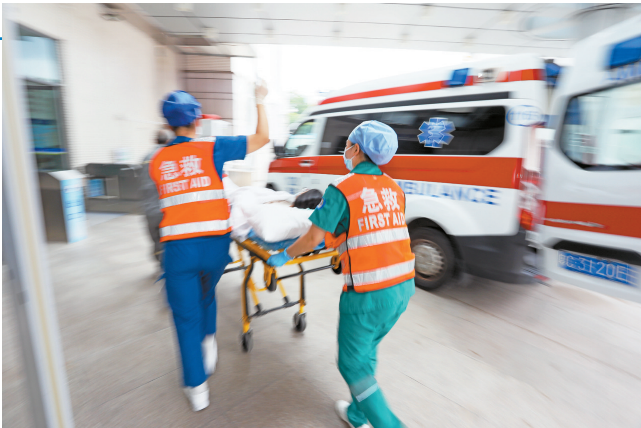
120救护车送来急诊患者。