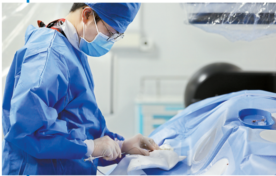
为患者行急诊介入手术。