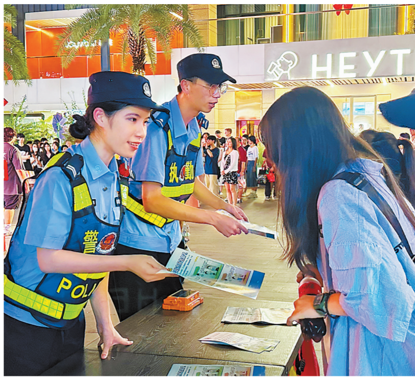
珠海市公安局开展全省夏夜治安巡查宣防第4次(全市第9次)集中统一行动。本报记者 吴长斌 通讯员 李鑫欣 摄

同时,全市公安机关民警辅警深入繁华商圈、网红景点、夜市摊点等重点人员聚集场所,设置集中宣传点51处,发放宣传资料25862份,播放宣传视频235条,受教育群众33611人,以群众喜闻乐见的形式,开展反诈、反盗窃、防溺水、防火灾、拒酒驾、拒黄赌毒等宣传教育,提高群众守法自觉和自我防护意识。