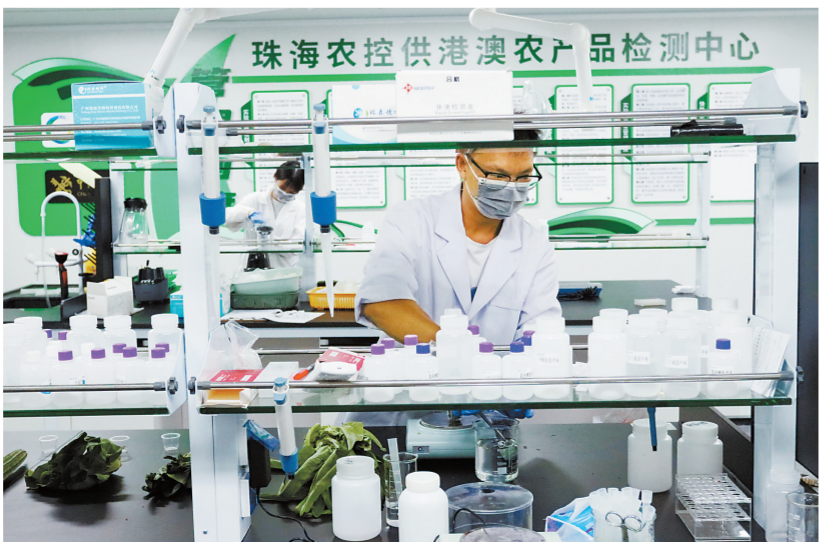
技术人员正在检测供港澳农产品的各项指标。

珠海作为港澳鲜活农产品的重要供应地,越来越多的新鲜蔬菜从这里“走出”,不断充实着港澳居民