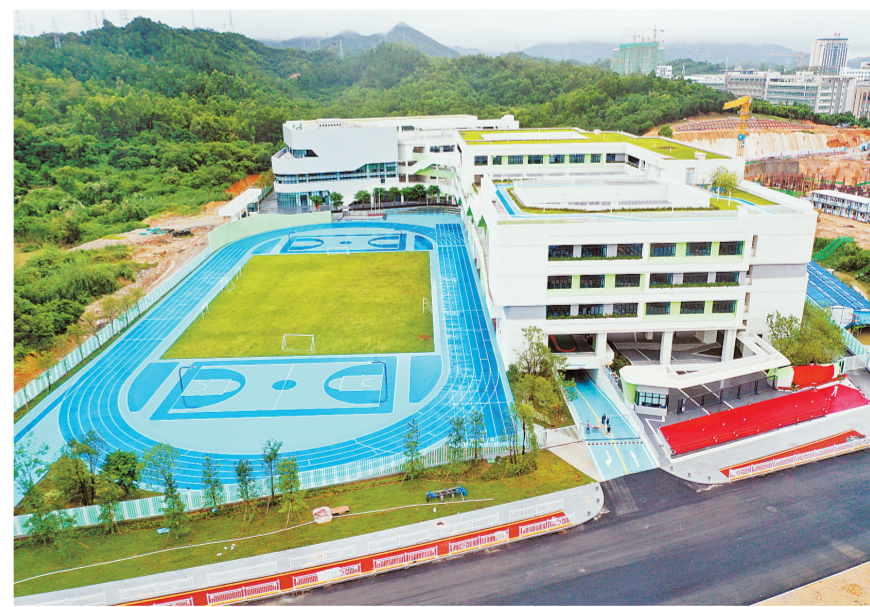
新启用的三溪实验小学。

本报讯 记者余映薇报道:9月9日上午,香洲区三溪实验小学、东桥小学分别举行揭牌暨启用仪式。作为珠海市香华实验教育集团的成员校区,两所新校投入使用后,将在核心校的辐射支持下,全面融入核心校教育教学体系,创办设施齐全、师资过硬的优质学校,助力我市教育高质量发展。