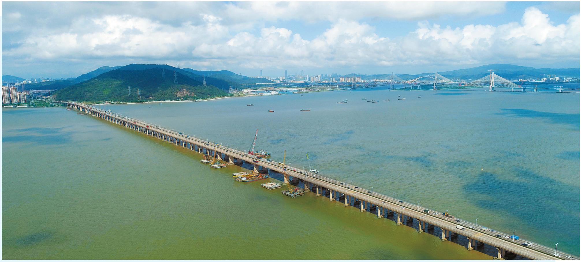
西江出海口磨刀门水道。