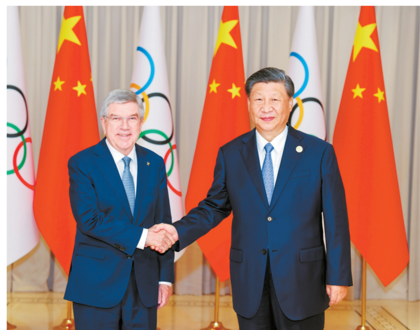
9月22日下午,国家主席习近平在杭州西湖国宾馆会见来华出席第19届亚洲运动会开幕式的国际奥林匹克委员会主席巴赫。

新华社杭州9月22日电 9月22日下午,国家主席习近平在杭州西湖国宾馆会见来华出席第19届亚洲运动会开幕式的国际奥林匹克委员会主席巴赫。