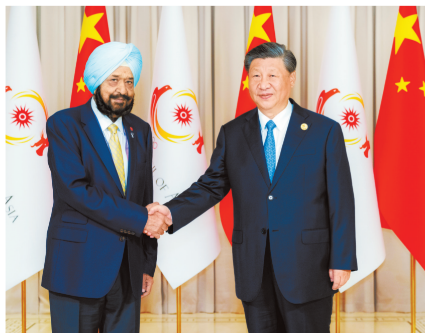
9月22日下午,国家主席习近平在杭州西湖国宾馆会见来华出席第19届亚洲运动会开幕式的亚洲奥林匹克理事会代理主席辛格。

新华社杭州9月22日电 9月22日下午,国家主席习近平在杭州西湖国宾馆会见来华出席第19届亚洲运动会开幕式的亚洲奥林匹克理事会代理主席辛格。