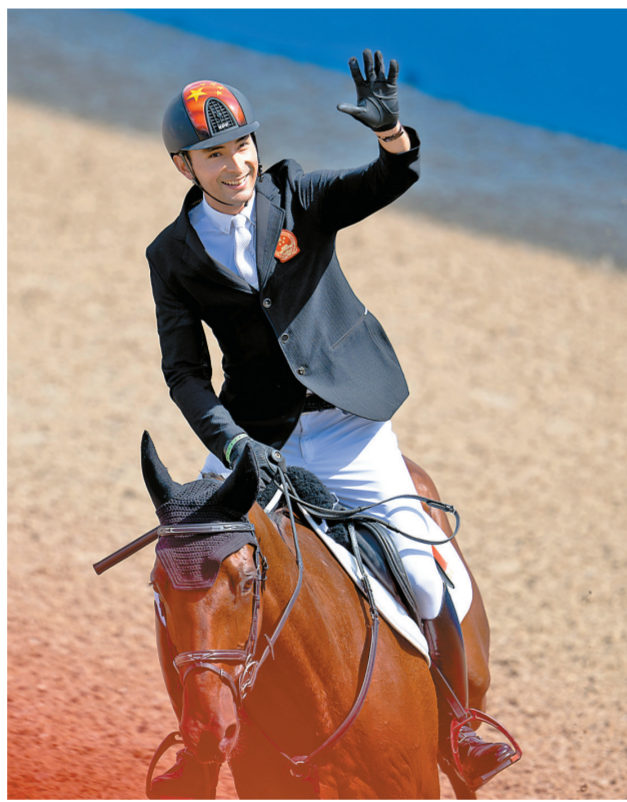
中国选手华天在比赛后向观众挥手致意。新华社

新华社杭州10月2日电 杭州亚运会马术三项赛2日完赛,中国队实现在亚运马术项目上金牌“零的突破”,将马术三项赛团体赛、个人赛金牌收入囊中。