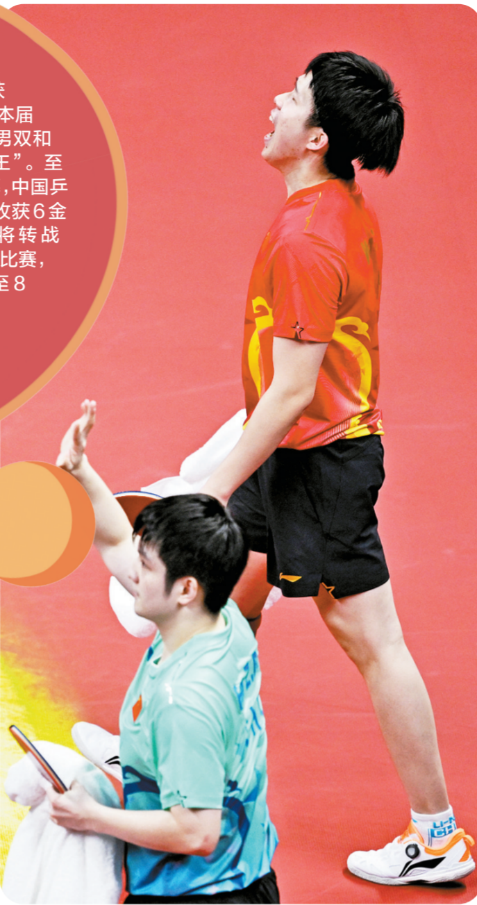
王楚钦(上)在男单决赛后庆祝胜利。

两人现世界排名前两位,本场堪称巅峰对决。双方第一局便打得难分难解,10:10后,樊振东连得两分拿下首局。第二局,王楚钦以5:0开局,但被樊振东追至9:9,之后10:10,关键时刻,王楚钦连得两分,将大比分改写为1:1。第三局,双方战至5:5后,王楚钦连得5分,率先到达局点,但樊振东连得6分,反以11:10领先,但此后王楚钦连得3分,以13:11赢下第三局。