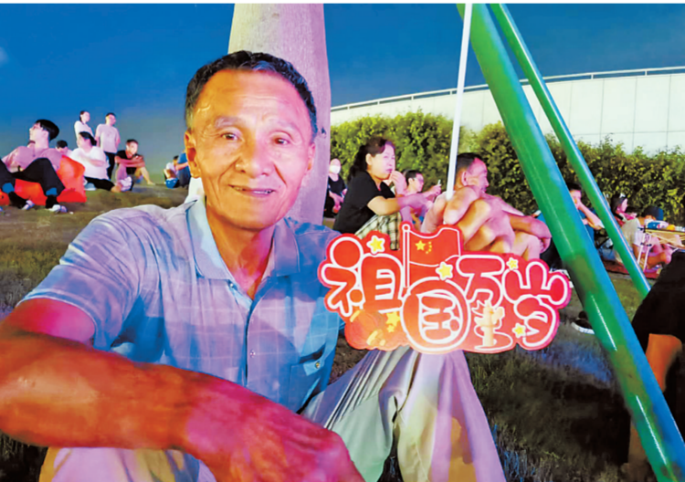
长者观看光影秀。