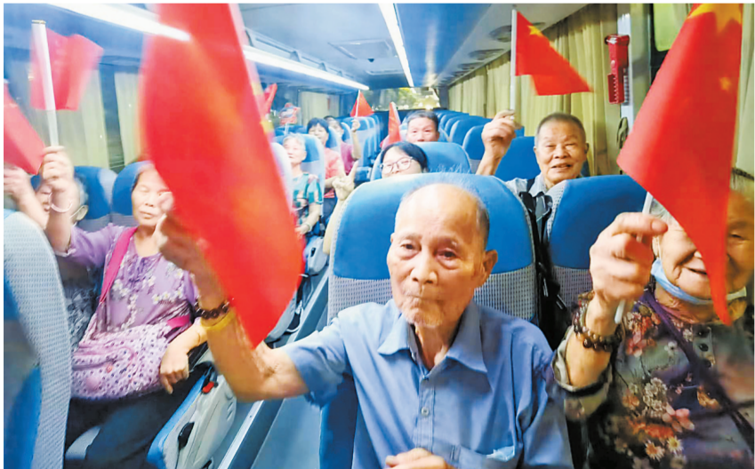
为了确保长者们的出行安全,主办方特地安排了大巴车接送。

横琴粤澳深度合作区的老龄事业是关乎琴澳两地百姓福祉的大事,目前,澳门长者和随迁长者持续增多。新家园社区居家养老服务中心负责人表示:“此次活动得到了社会各界的助力和关心,光影秀现场很多居民游客主动为长者让行,关爱长者,希望通过举办这次活动,带动社会各界更加关心琴澳老人,让更多人感受合作区宜居宜业的生活环境。”