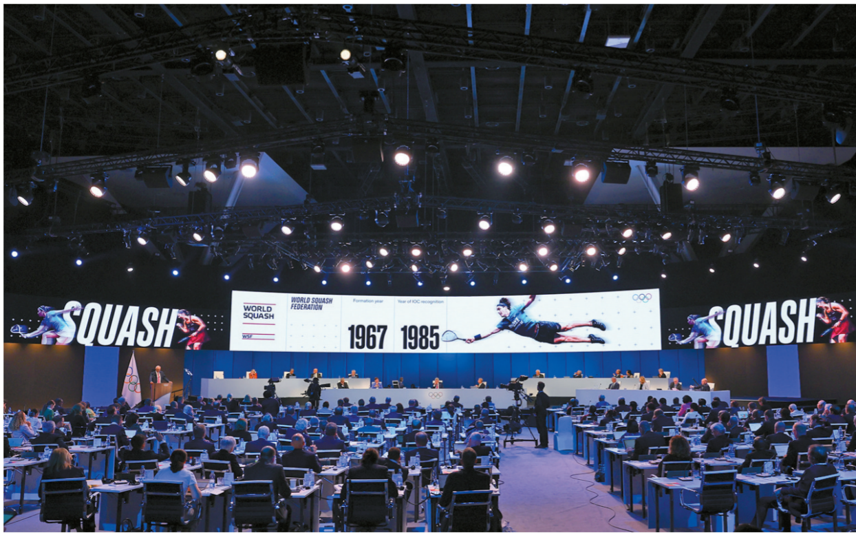
10月16日会议现场大屏幕展示的壁球项目。