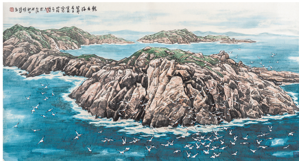
龙出海(国画) 古锦其