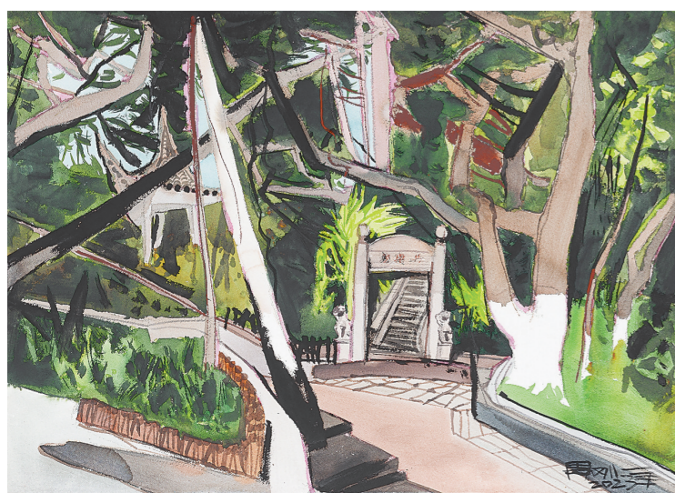
珠海唐家湾共乐园(水彩画) 周刚