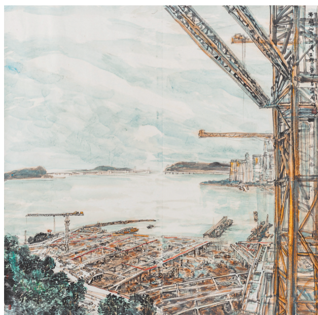
沸腾的九州港工地(国画) 祁海峰