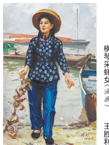
横琴采蚝女(油画) 王胜利