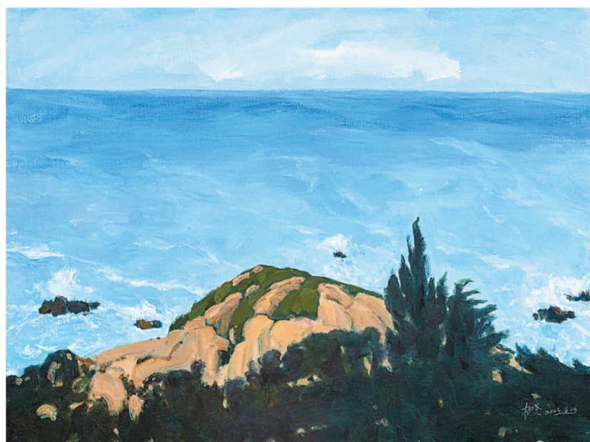
伶仃洋里望伶仃(油画) 杨尧