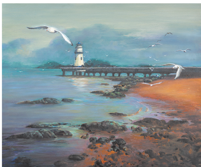
珠海故事·灯塔(油画) 刘文伟