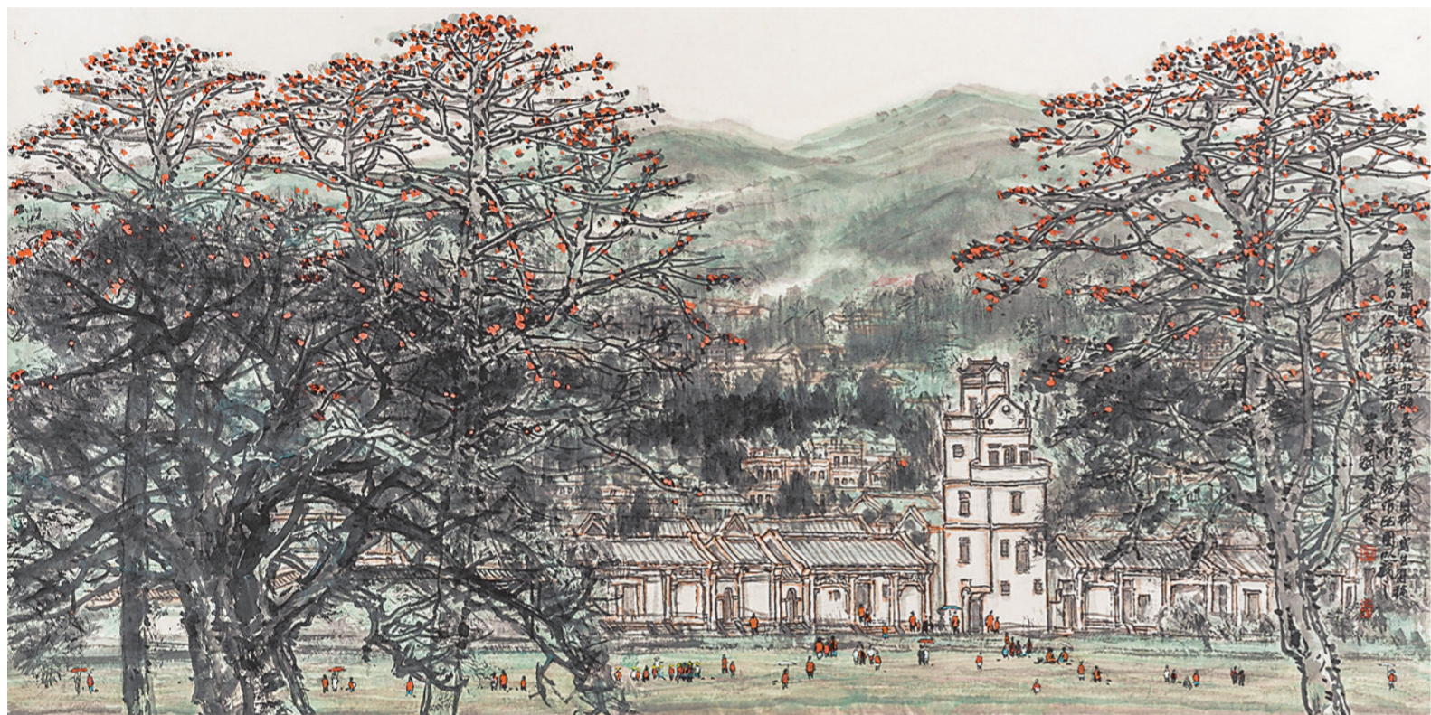
会同春晓(国画) 马新林