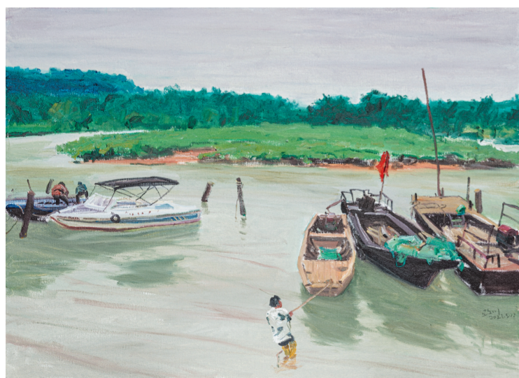
珠海红树林一隅(油画) 邵亚川