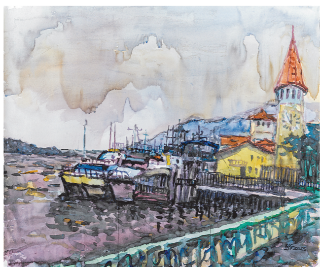
珠海横琴码头(水彩画) 骆献跃