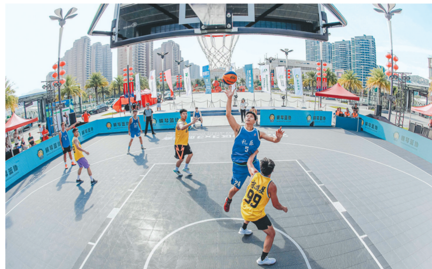
横琴分站赛上演精彩对决。

本报讯 记者陈子怡报道:经过激烈角逐,“2023大湾区3×3篮球赛”横琴分站赛近日收官,戎福控股战狼联队获横琴站冠军。该赛事总决赛将于10月25日至29日在澳门著名地标大三巴牌坊前地举行。