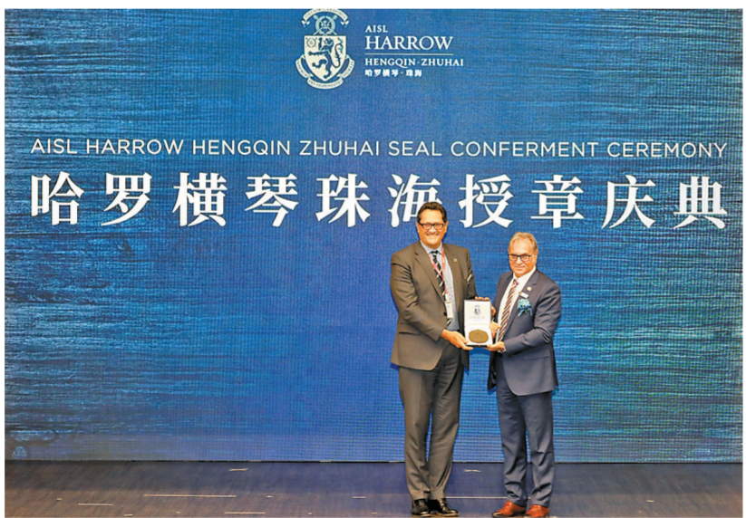
横琴哈罗礼德学校举行授章仪式。

章,寓意哈罗卓越教育底蕴贯彻传承,并通过AISL集团“育以至善,卓以领航”的愿景发扬光大,惠及亚洲各地学子。