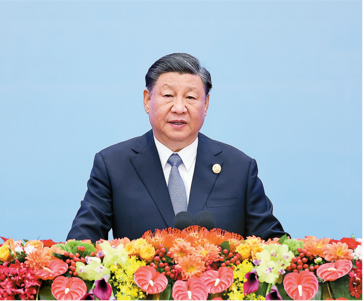
10月18日上午，国家主席习近平在北京人民大会堂出席第三届“一带一路”国际合作高峰论坛开幕式并发表题为《建设开放包容、互联互通、共同发展的世界》的主旨演讲。