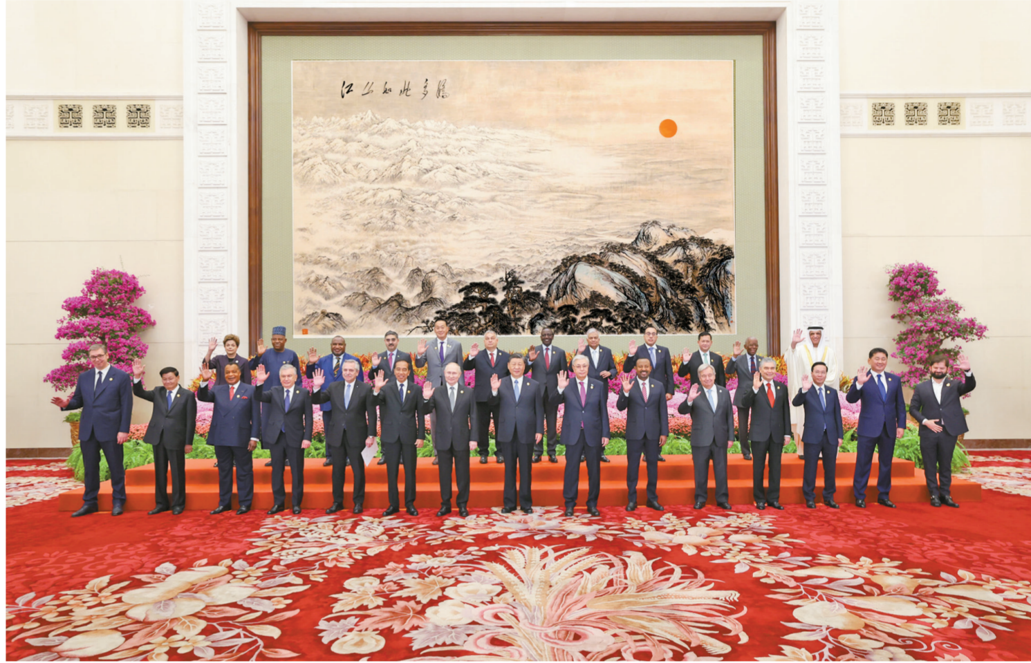
10月18日上午，国家主席习近平在北京人民大会堂出席第三届“一带一路”国际合作高峰论坛开幕式并发表题为《建设开放包容、互联互通、共同发展的世界》的主旨演讲。这是会前，习近平同出席高峰论坛的外国国家元首、政府首脑和国际组织负责人等国际贵宾集体合影。

新华社北京10月18日电 10月18日上午，国家主席习近平在人民大会堂出席第三届“一带一路”国际合作高峰论坛开幕式并发表题为《建设开放包容、互联互通、共同发展的世界》的主旨演讲。习近平宣布中国支持高质量共建“一带一路”的八项行动，强调中方愿同各方深化“一带一路”合作伙伴关系，推动共建“一带一路”进入高质量发展的新阶段，为实现世界各国的现代化作出不懈努力。 金秋时节，天高气爽，风清气朗。天安门广场上，共建“一带一路”国家国旗迎风飘扬，相映成辉。 出席高峰论坛的外国国家元首、政府首脑和国际组织负责人等国际贵宾陆续抵达。人民大会堂东门大厅两