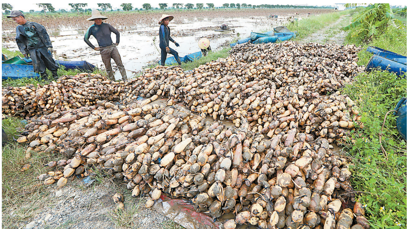
等待冲洗装车的莲藕。