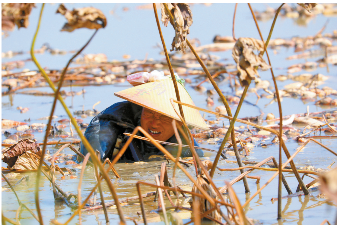
采藕工人利用高压水枪挖藕。