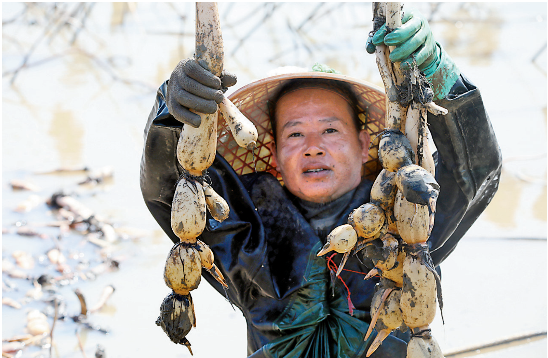
采藕工人展示刚刚挖上来的莲藕。