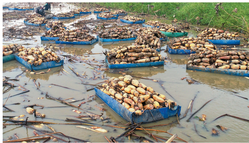
刚从荷塘拉回来的莲藕等待上岸。