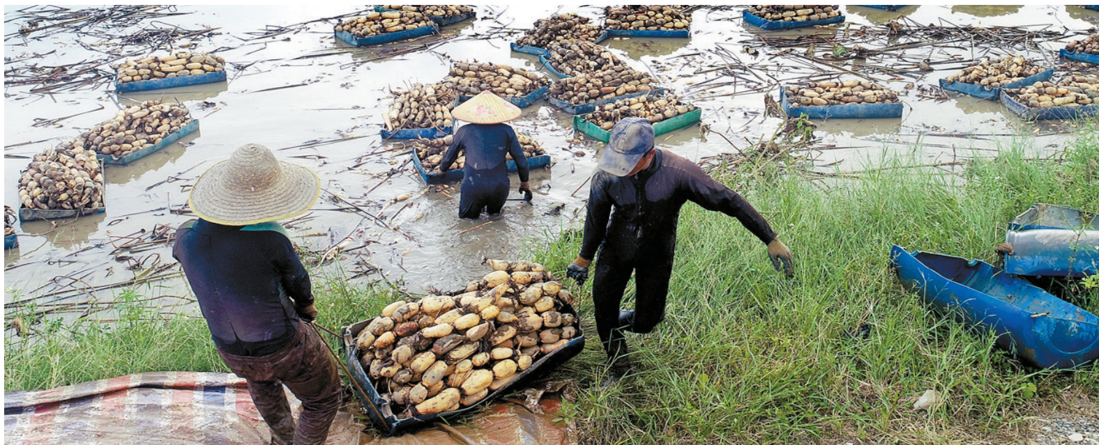
采藕工人将一筐筐莲藕往岸边搬运。