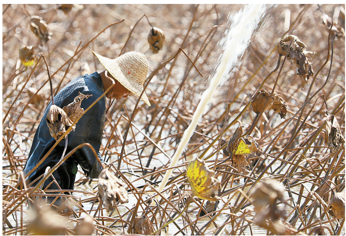
工人用高压水枪将莲藕与淤泥分离。