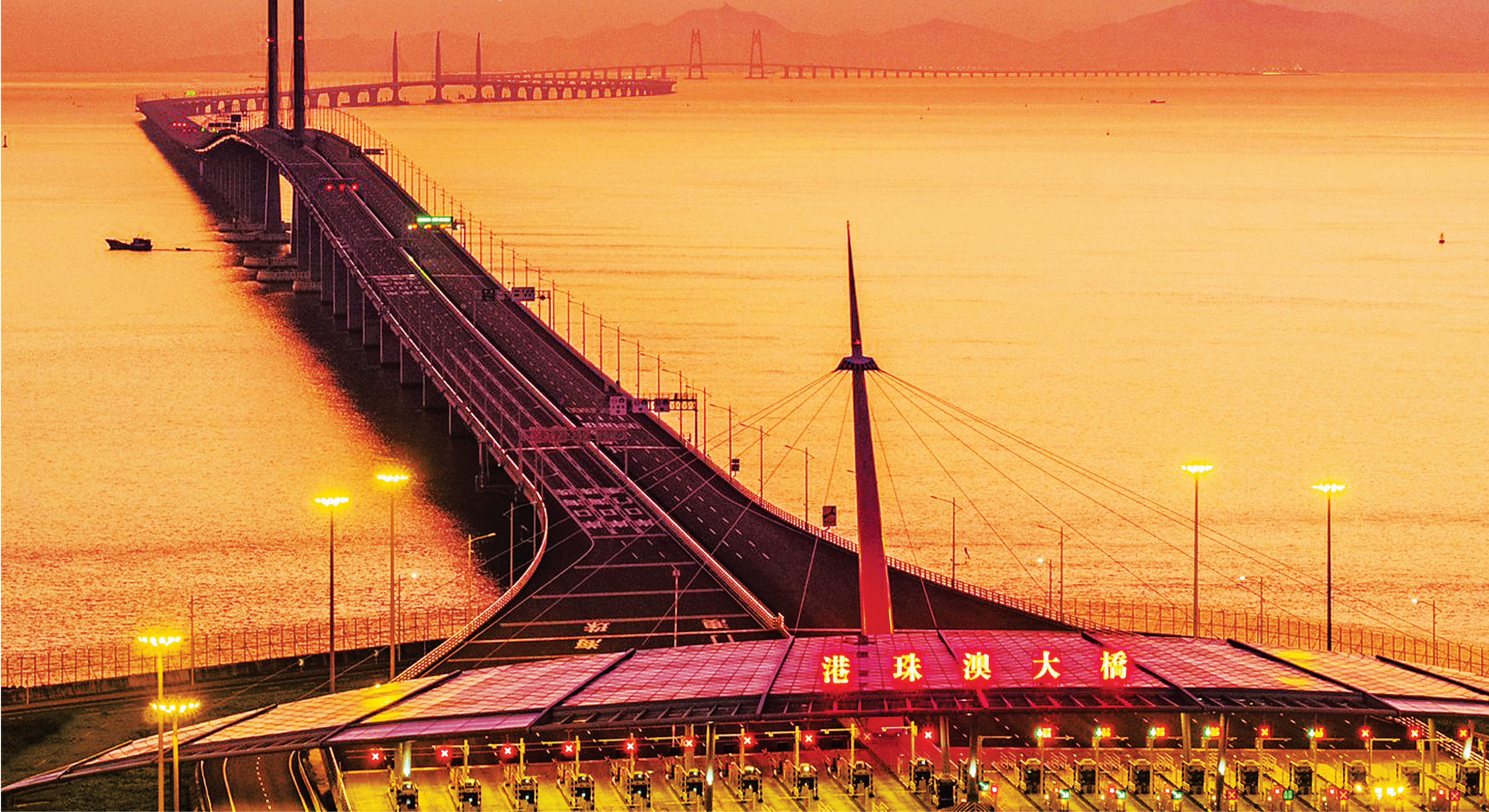
港珠澳大桥是一座圆梦桥、同心桥、自信桥、复兴桥。