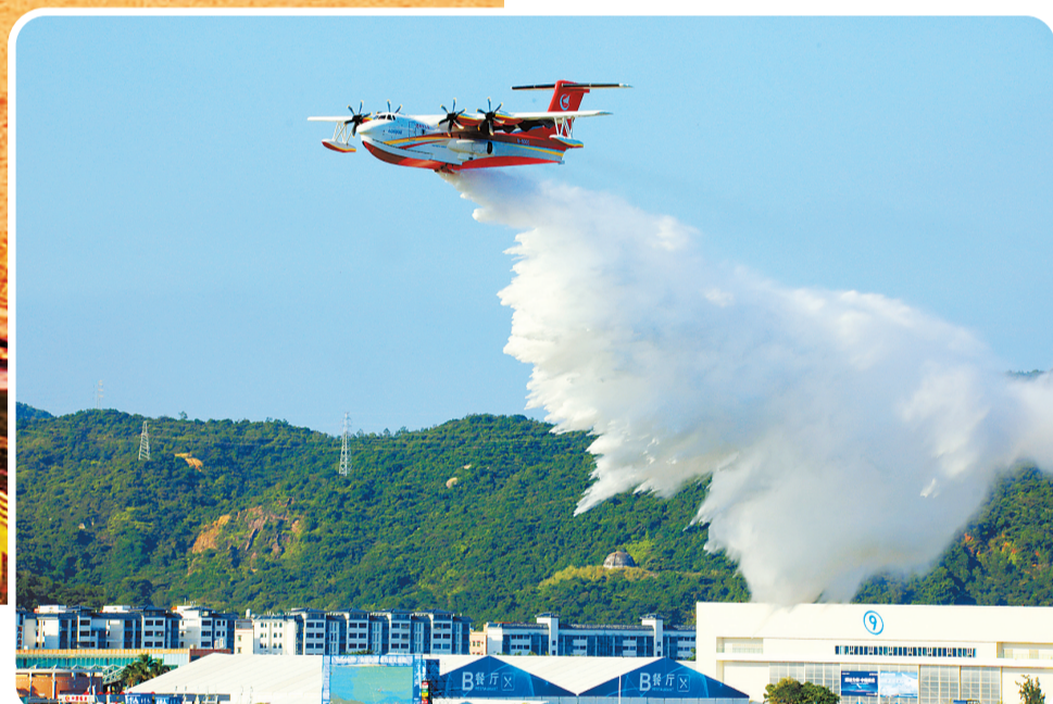
AG600M在第十四届中国航展进行技术表演。