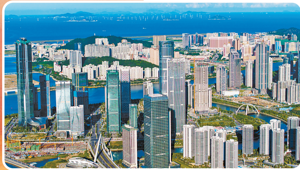
横琴粤澳深度合作区。

关注。航空工业通飞相关负责人介绍,AG600已于今年6月在西昌完成高原山区典型灭火场景试飞,顺利通过专家组评审,已具备执行灭火任务能力,迈出了从研制到运营的重要一步。后续,AG600研制团队将围绕落实习近平总书记重要指示批示以及中共中央、国务院要求,构建以AG600平台为主装备的系列化、谱系化发展格局,建设“研-组结合”的陆海空协同应急救援和日常防治体系示范中心,让AG600成为国家、地方、专业机构多层次立体救援体系的重要力量,成为世界领先的重大航空装备。