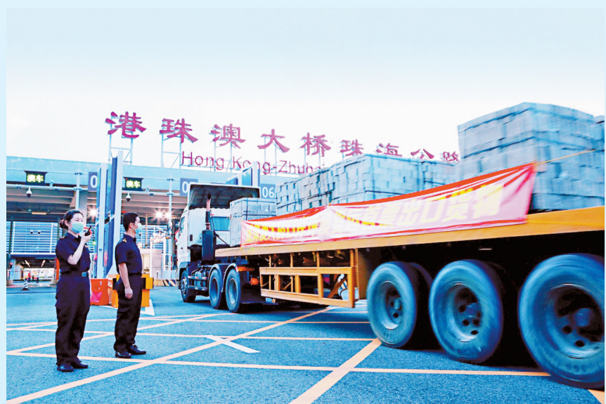
2020年8月16日,港珠澳大桥珠海公路口岸澳货运通道正式启用。