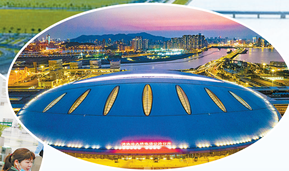
港珠澳大桥口岸人工岛。