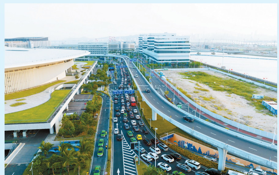
2023年10月2日,港珠澳大桥珠海公路口岸单日出入境车辆首次突破1.4万辆次。