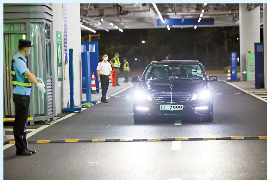
2023年7月1日零时9分,首辆香港单牌车经港珠澳大桥驶入珠海。