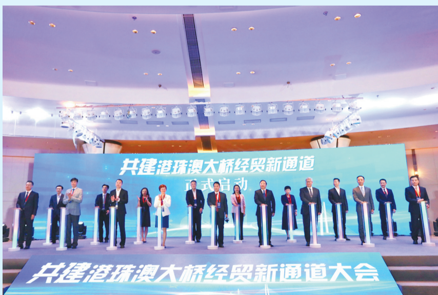
2023年6月28日,共建港珠澳大桥经贸新通道大会在珠海召开。