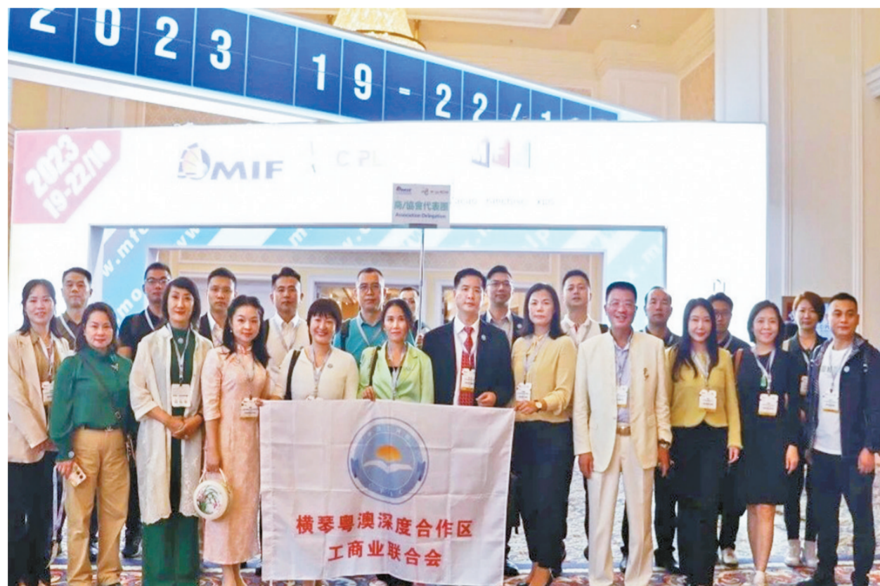
参与活动的企业代表合影。

10月20日上午,横琴工商联企业代表与澳门贸易投资促进局主要负责人进行座谈交流。双方针对“澳门人才引进计划”“澳门企业工商注册”等问题进行深入交流,并互赠纪念品。