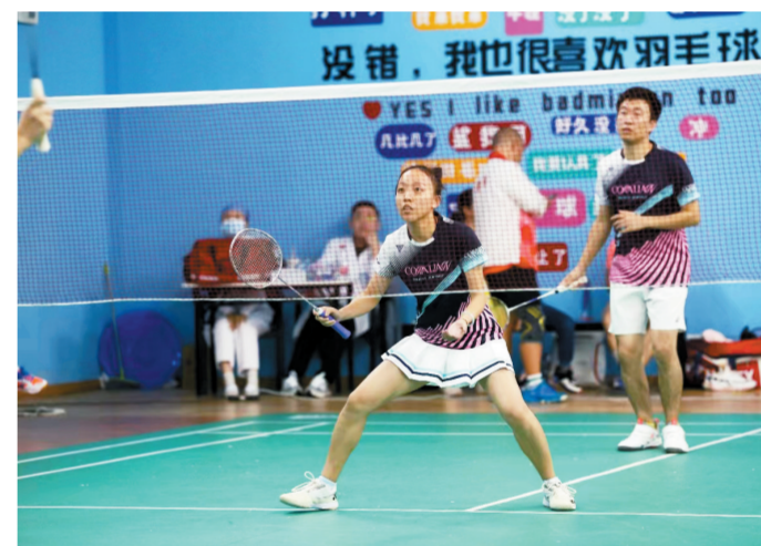
比赛现场。

本报讯 记者陈子怡报道:10月21日至22日,由横琴粤澳深度合作区民生事务局主办的2023年“琴澳杯”羽毛球单项赛在彩虹苑羽毛球馆开赛,吸引来自琴澳200多名运动员参赛,其中22名运动员来自澳门。